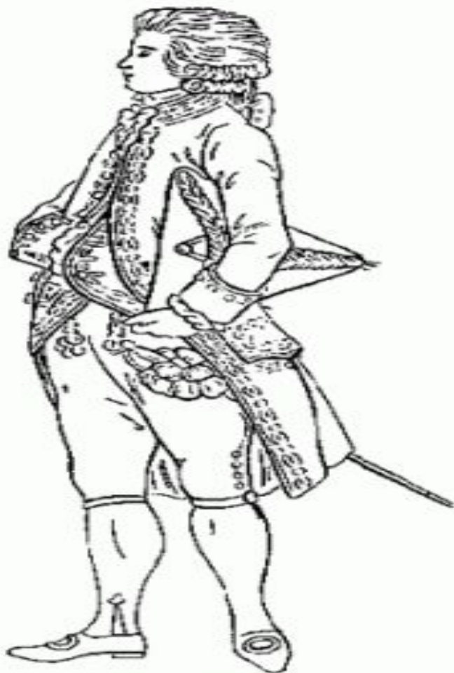
Fig. 437. MEN'S DRESS, ABOUT 1780