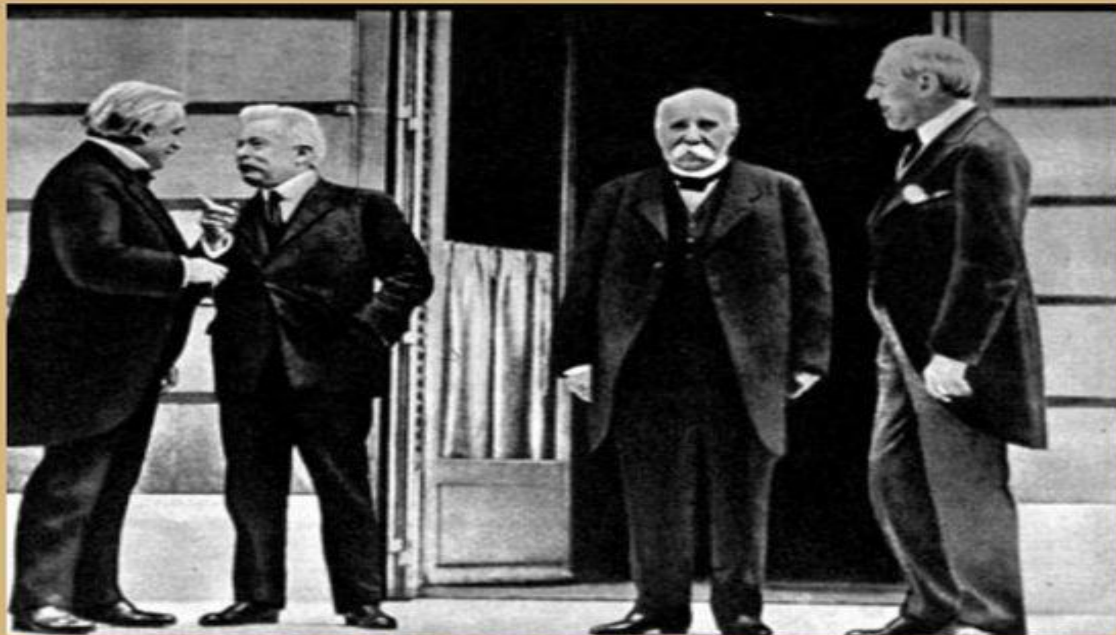
Подписавшие стороны Версальского мира, Ж. Клемансо, В. Вильсон, Д. Ллойд Джордж. Париж, 1919 год.