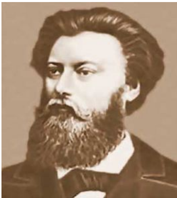
Павел Николаевич Яблочков