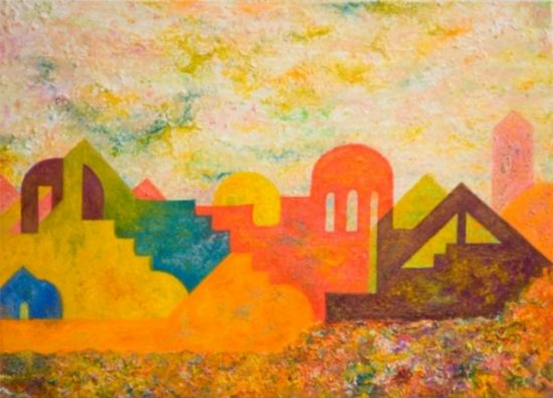
"Maya" 70 x 50 cm 2006