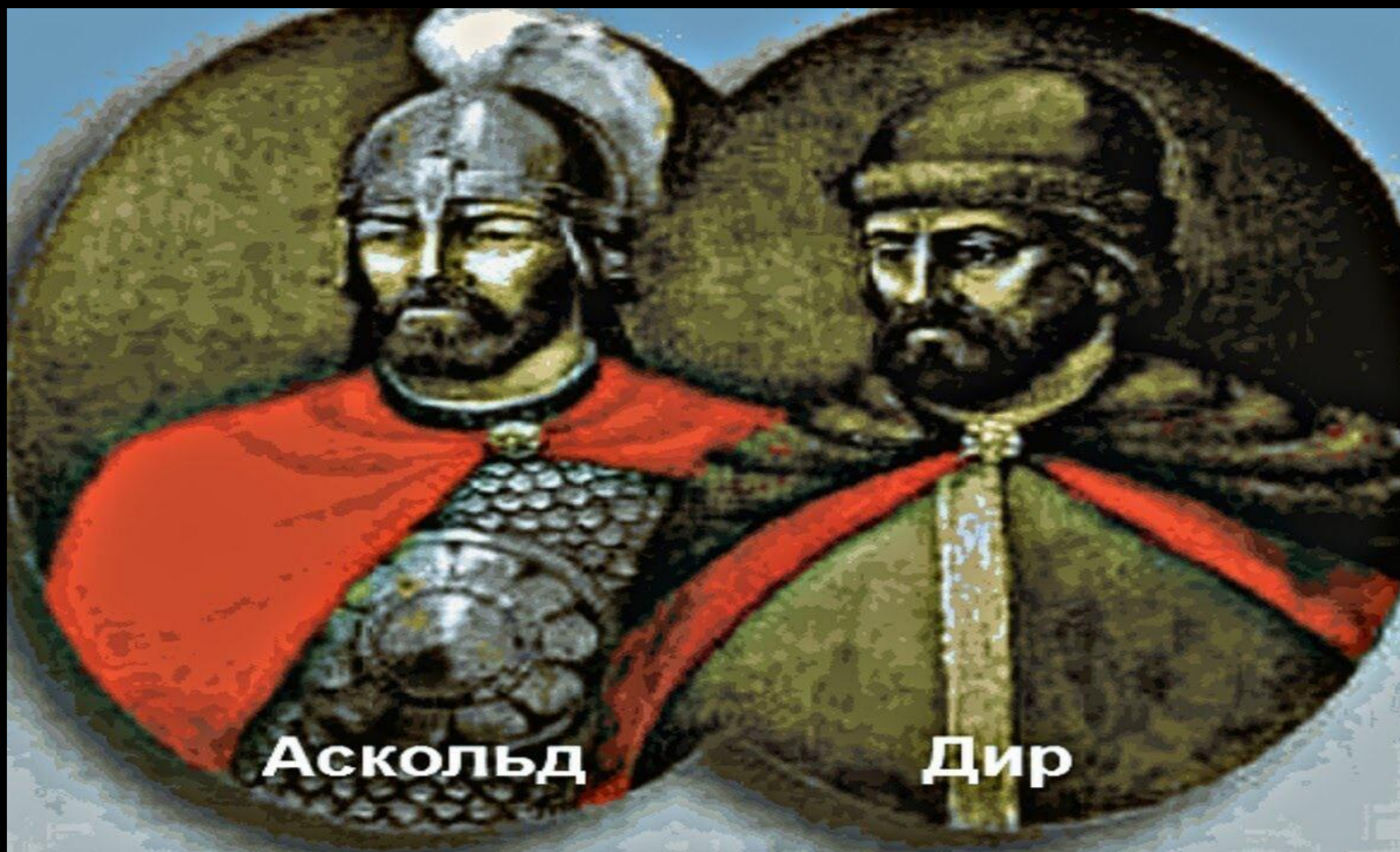
Аскольд и Дир (правили в Києве)