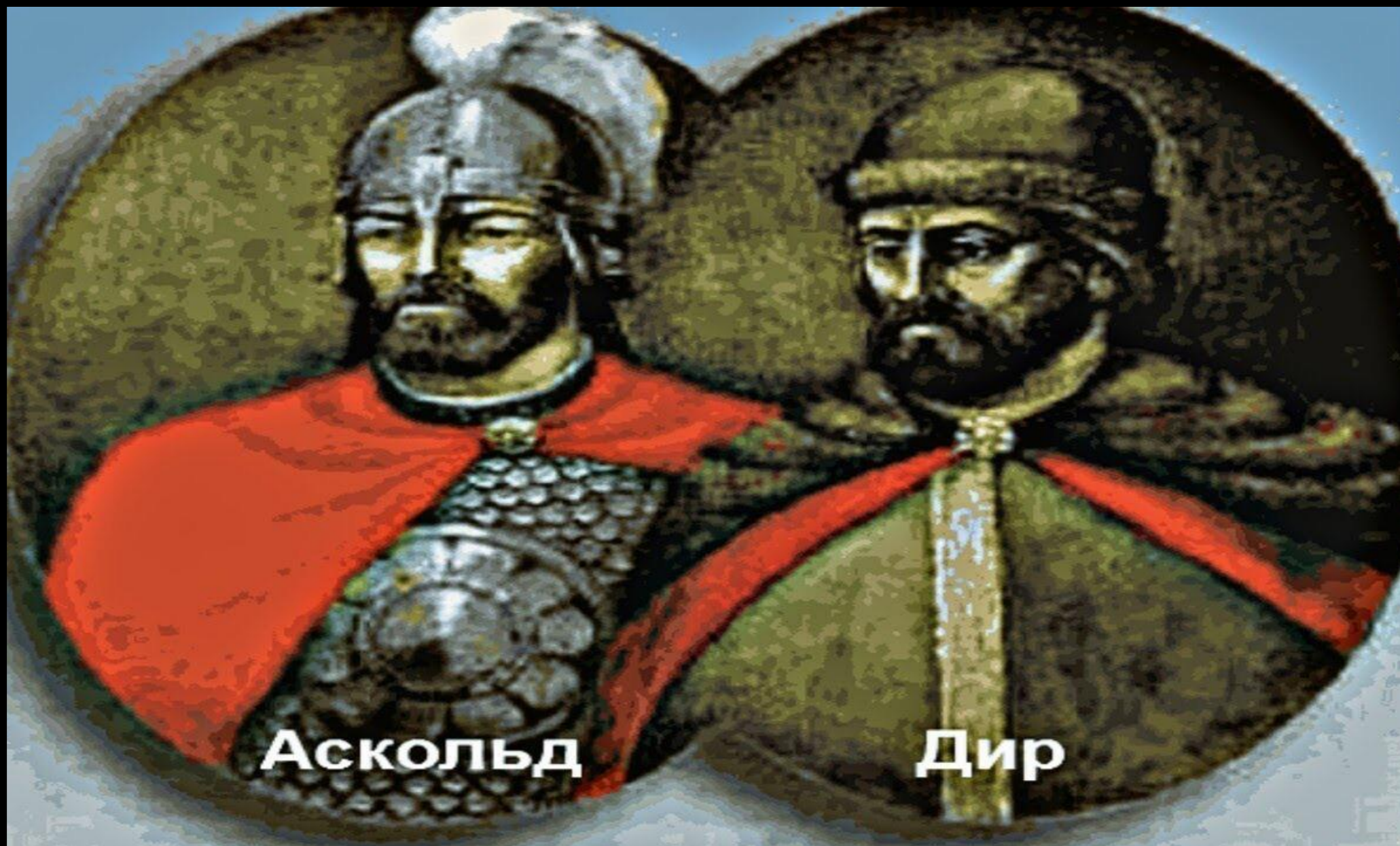
Аскольд и Дир (правили в Києве)