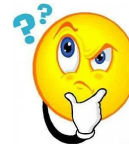
Найденные предложения на рынке

Величиной прочих затрат в целях данной задачи пренебречь.