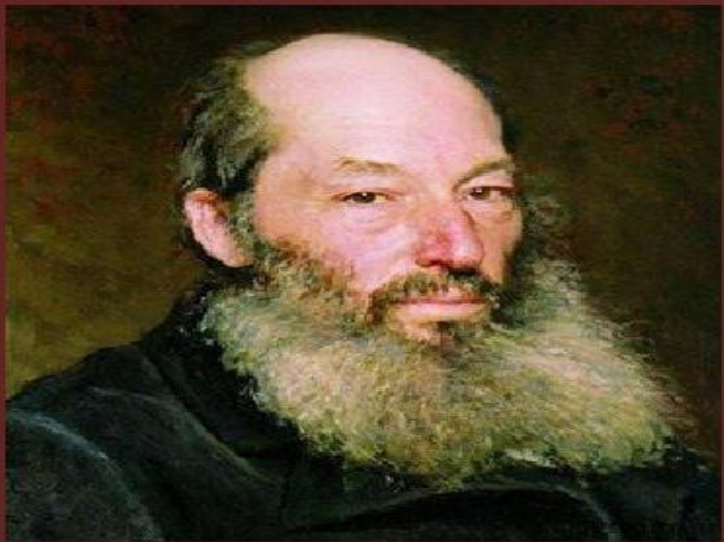
Афанасий Афанасьевич Фет (1820-1892)

Афанасий Афанасьевич Фет – известный русский поэт с немецкими корнями, переводчик, лирик, автор мемуаров.