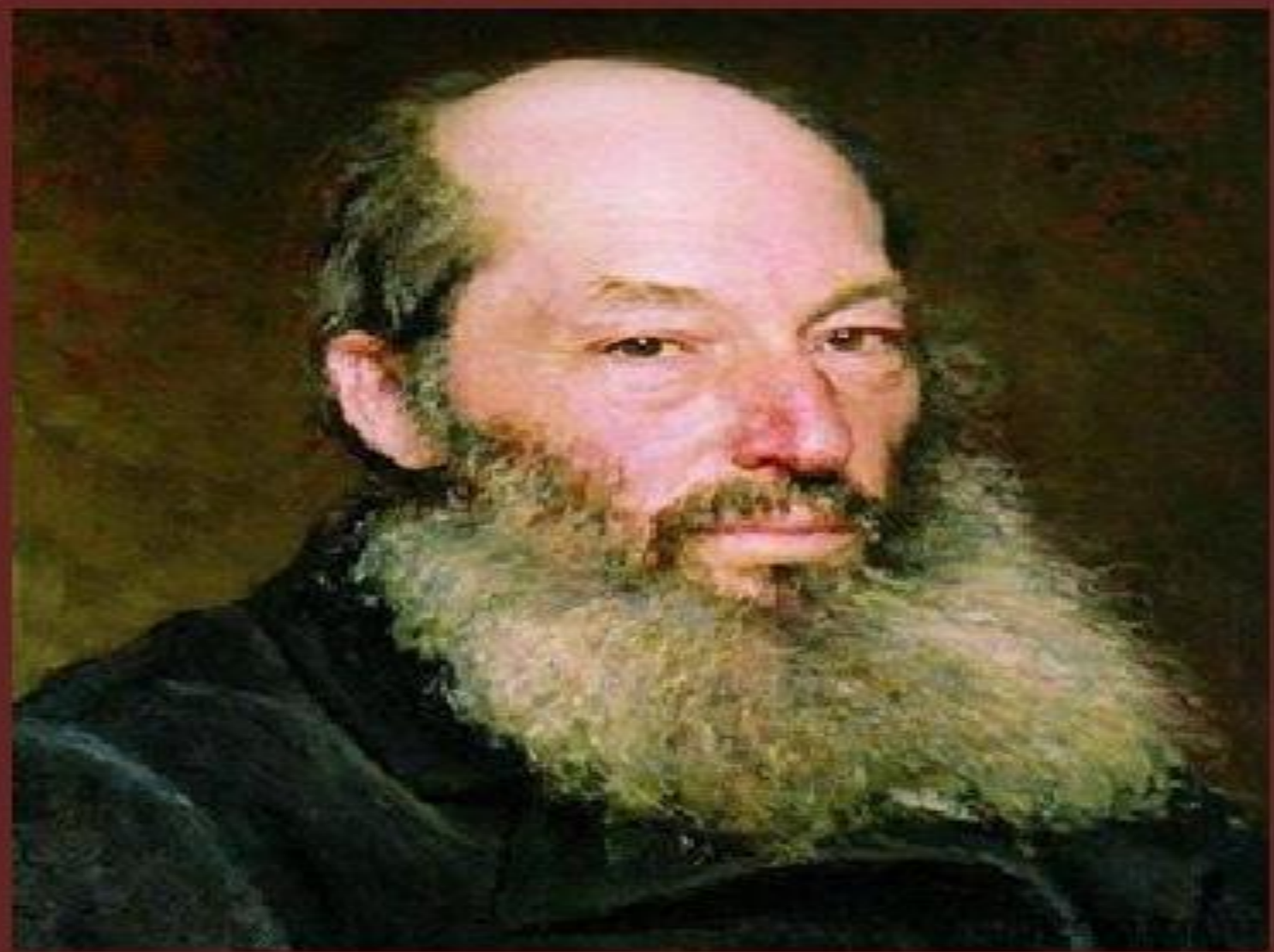
Афанасий Афанасьевич Фет (1820-1892)

Афанасий Афанасьевич Фет – известный русский поэт с немецкими корнями, переводчик, лирик, автор мемуаров.