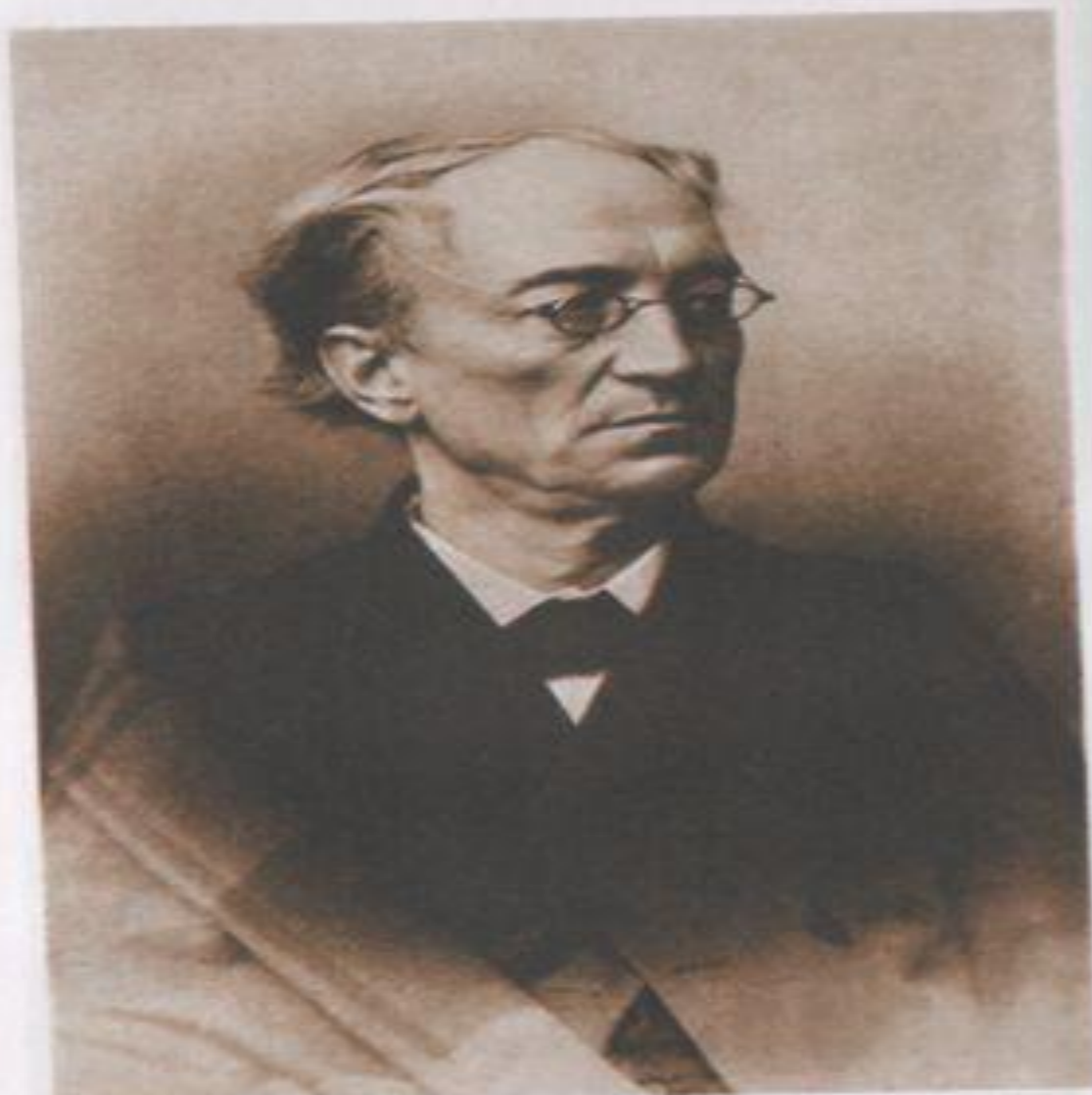
Ф. И. Тютчев. 1864 г.