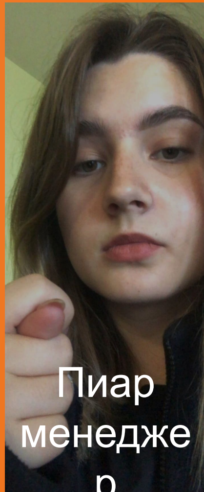
Пиар менедже р