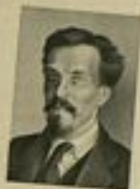
А. В. РЫКОВ