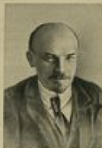
В. И. УЛЬЯНОВ-ЛЕНИН