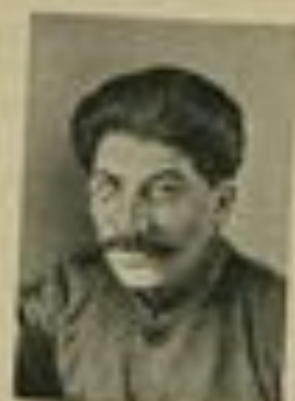
К. В. СТАЛИН