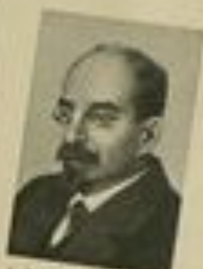
А. В. ЛУНАЧАРСКИЙ