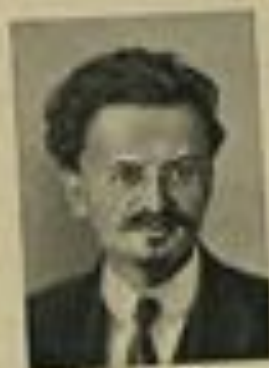
Д. Д. ГОРЬКИЙ