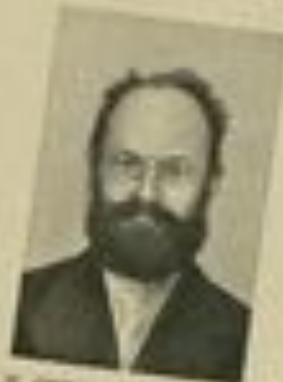
Н. К. СЕМЕНОВЪ (СТЕВАНОВЪ)