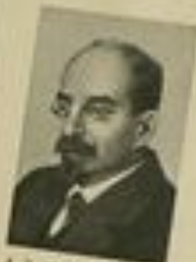
А. В. ЛУНАЧАРСКИЙ