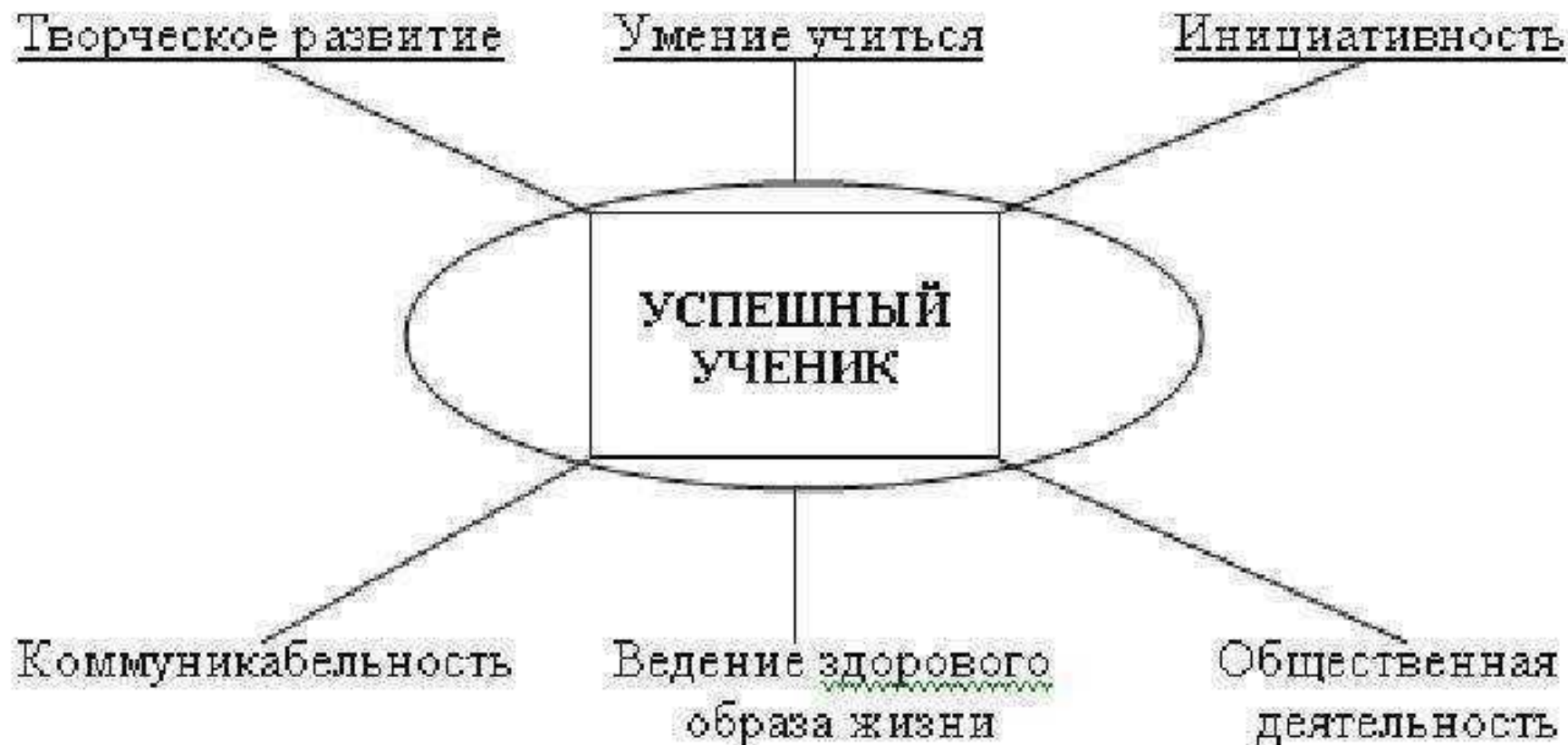
Рис. 1. Критерии успешности ученика.