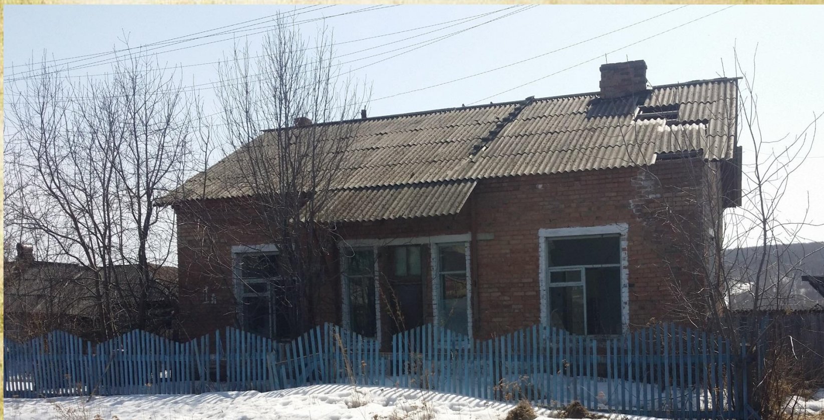
Здание семенной лаборатории