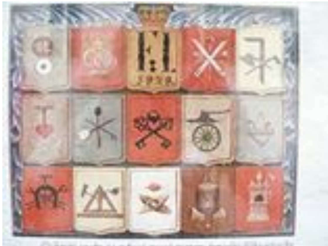
Гербы цехов в городе в Чешской Республике с символикой различных европейских средневековых ремёсел