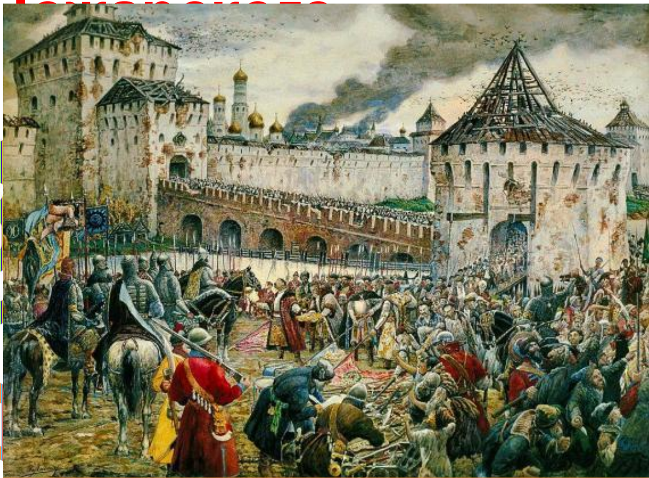
Э.Лисснер. Изгнание поляков из Кремля.

На штурм ополченцы шли с Казанской Иконой Божьей Матери. Собралось войско более 10 тысяч, которое 4 ноября 1612 года взяло штурмом Китай-город и изгнало поляков из Москвы.