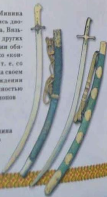
► Сабля Минина и Пожарского

«Первыми на призыв Минина и Пожарского откликнулись дворяне и жители Дорогобужа, Вязьмы, Казани, Ярославля и других городов. Каждый дворянин обязан был явиться в войско «с конем, с луком, с оружием», т. е. со своими доспехами, на своем коне и в сопровождении трех-четырех полностью вооруженных холопов»