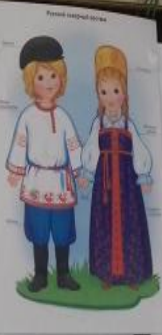
Русский народный костюм