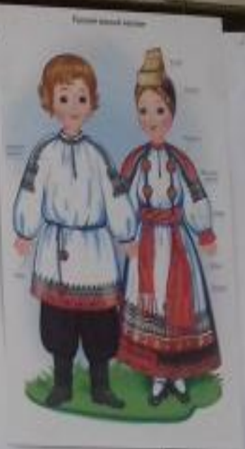
Русский народный костюм