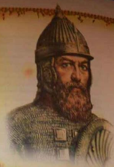
▲ Князь Дмитрий Михайлович Пожарский отличался храбростью и полководческим талантом. Во Втором земском ополчении он возглавлял русские войска, освобождавшие Москву