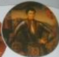
Александр I в военной форме, 1825 г.

Возвращение Александра I в Россию произошло 14 октября 1825 года. Александр I был принят в Царском Селе императрицей Марией Федоровной. В этот день он был объявлен наследником престола.