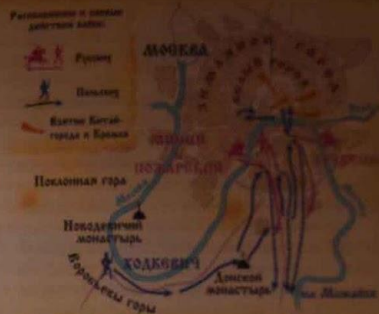
▲ Сражение русского ополчения с поляками 22 – 24 августа 1612 года

▼ Э. Лассер. Изгнание польских интервентов из Московского Кремля. В октябре 1612 года, во второй раз в год, поляки, засевшие в Кремле, оказались на самотеку. Москва, а вслед за ней и весь Русский мир, была освобождена от интервентов. Русь воспряла душой, почувствовала свою силу. Хотя и отплатила вражеским полкам за войну кровью, лишь пробиться к Москве, но снова интервенты пораженки. Отступая им доводилось слышать в Близнецах от чужеземцев, но и на русский народ не собирались оставлять врагу