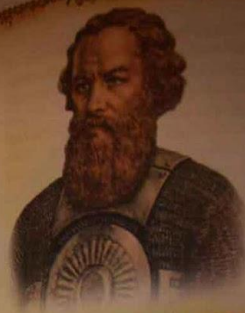
▲ Нижегородский купец Кузьма Минин стал одним из организаторов Второго земского ополчения. По его призыву русские люди начали собирать средства на формирование войска для борьбы с польскими интервентами