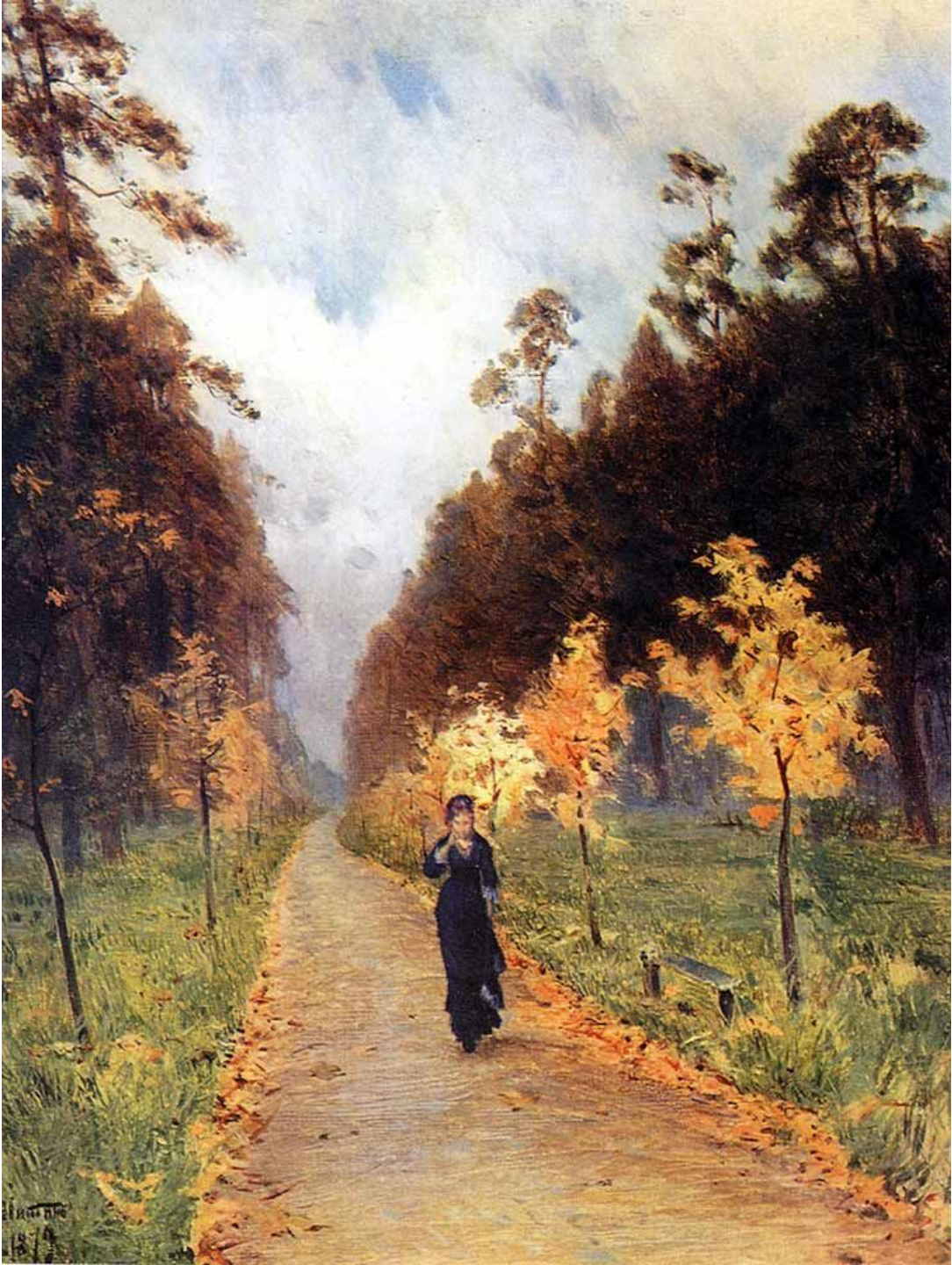
Картина И.И. Левитана «Осенний день. Сокольники»