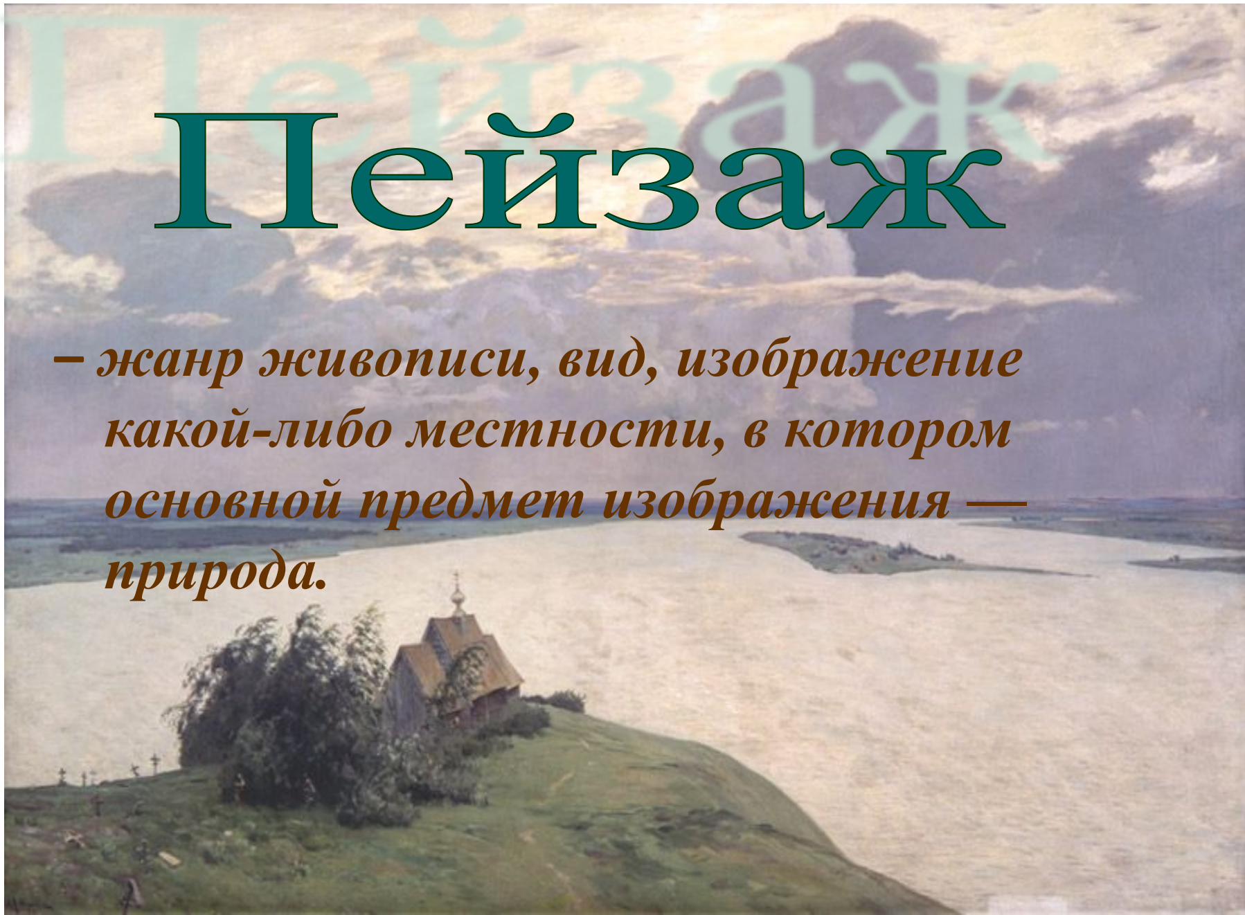
И.Левитан Над вечным покоем

– жанр живописи, вид, изображение какой-либо местности, в котором основной предмет изображения — природа.