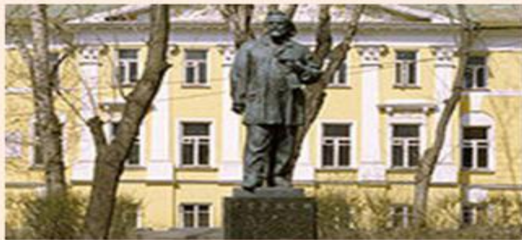
Памятник Герцену в Москве

"Отцы" отшатнулись от него за "радикализм", а "дети" - за "умеренность". Умер 21 (по старому стилю - 9) января 1870 в Париже. Похоронили Герцена сначала на кладбище Pere Lachaise, а потом прах его был перевезен в Ниццу, где он покоится до настоящего времени.