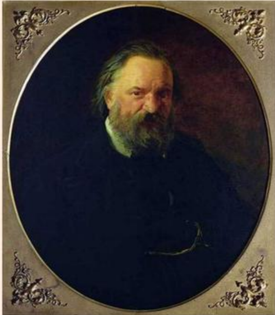
Николай Ге. Портрет Герцена