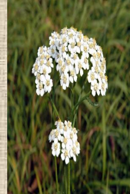
Тысячелистни к обыкновенны й