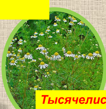
Тысячелистник Ромашка аптечная