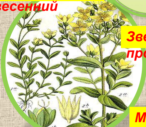
шалфе Зверобой продырявленный