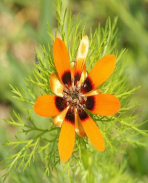
Адонис Восточный а