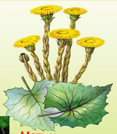
Мать и мачеха