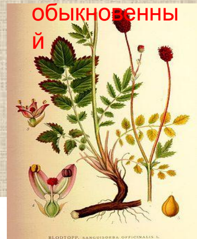
Кровохлебка лекарственна я