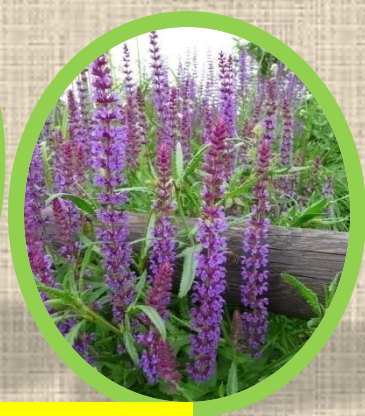
шалфе Зверобой продырявленный