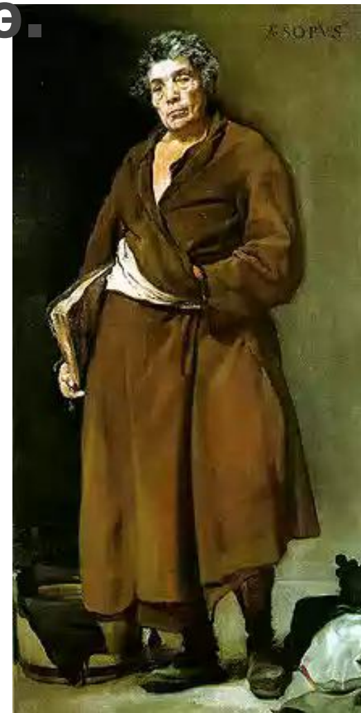
Картина Диего Веласкеса