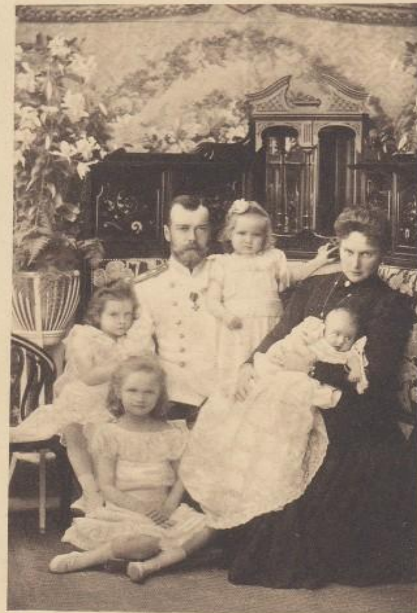
ИХЪ ИМПЕРАТОРСКИИ ВЕЛИЧЕСТВА ГОСУДАРЬ ИМПЕРАТОРЪ И ГОСУДАРИНИ ИМПЕРАТРИЦА АЛЕКСАНДРА ФЕОДОРОВНА СЪ АВГУСТЪЙШИМИ ДЕТЬМИ. LEURS MAJESTÉS L'EMPEREUR ET L'IMPÉRATRICE ALEXANDRA FEODOPOVNA AVEC LEURS AUGUSTES ENFANTS.

В семье родились 4 дочери: святые мученицы великие княжны Ольга (1895), Татiana (1897), Мария (1899), Анастасия (1901).