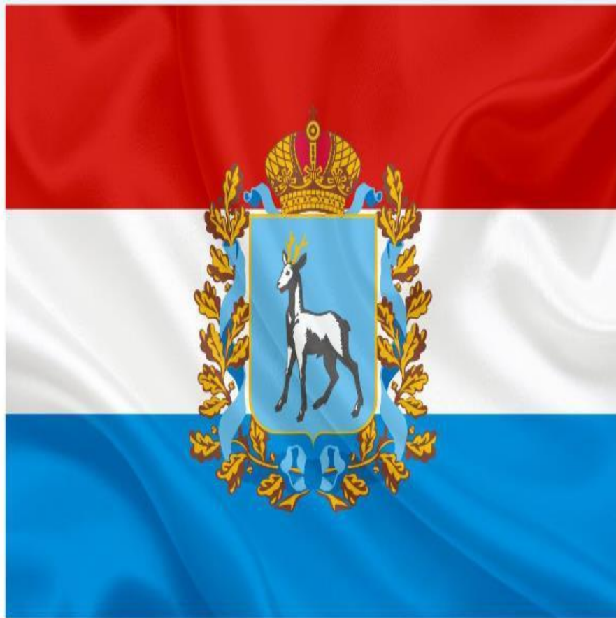
Флаг Самарской области.

Флаг Самарской области представляет собой прямоугольное полотнище из трёх горизонтальных полос: верхней - красного; средней - белого; нижней - синего. В середине флага изображён Герб Самарской области.