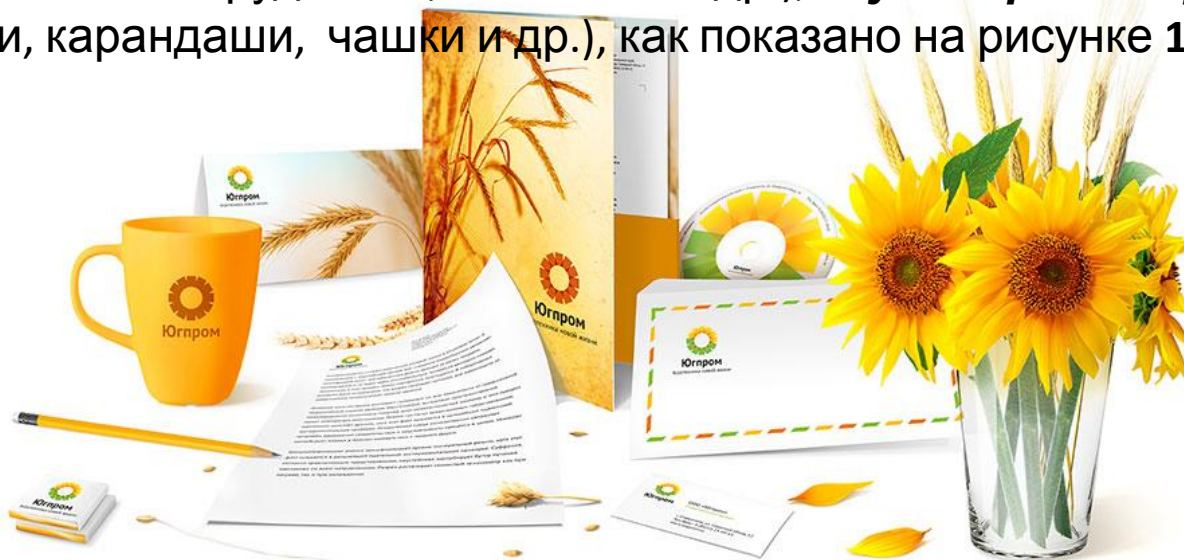
Рисунок 1.1 – Элементы фирменного стиля компании «Югпром»

Пример. ... Основными носителями элементов фирменного стиля являются: печатная реклама (плакаты, листовки, проспекты, каталоги, буклеты, календари и др.); элементы делопроизводства (фирменные бланки, конверты, папки, записные книжки, блоки для бумаг и др.); документы и удостоверения (пропуски, визитные карточки, удостоверения сотрудников, значки и др.); сувенирная продукция (авторучки, карандаши, чашки и др.), как показано на рисунке 1.1.