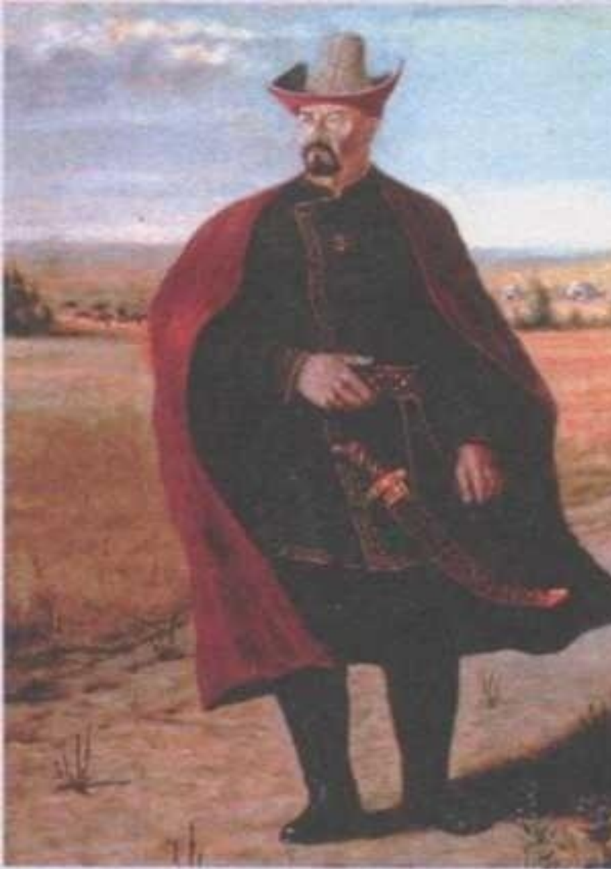
Сырым-батыр. Художник М.Кал МОВ