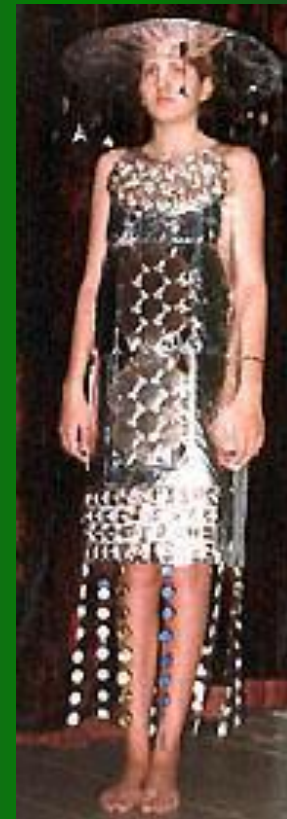
«Инопланетянка» (пластик, пробки)