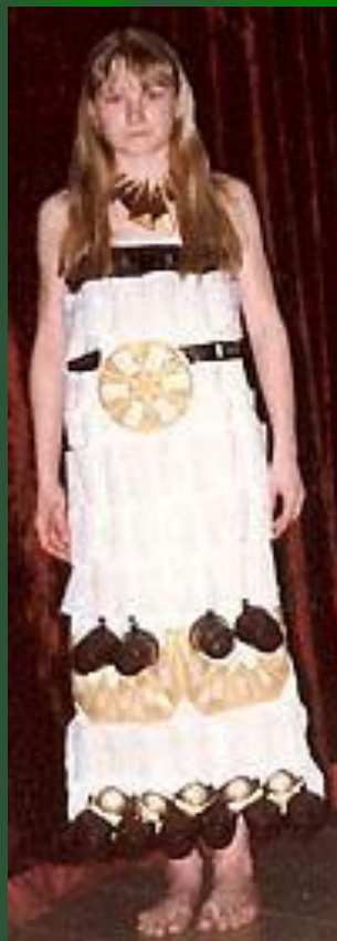
«Египтянка» (пластиковая посуда)