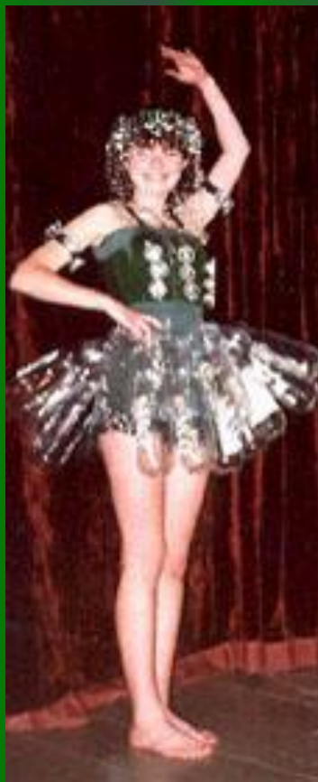
«Стеклянная статуэтка» (пластик, бумага)