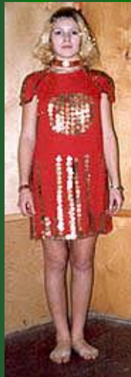
«Воспоминания о битве»