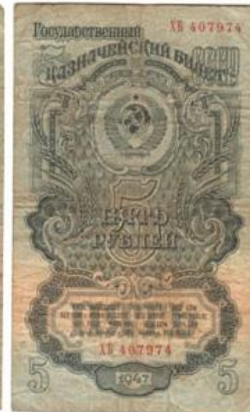
Денежные знаки образца 1947 года