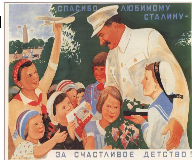
463. Говорков В. Спасибо любимому Сталину — за счастливое детство! 1936