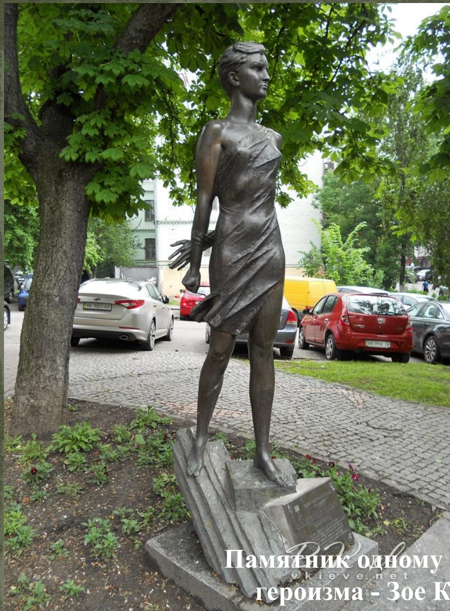
Памятник одному из ярких примеров героизма - Зое Космодемьянской