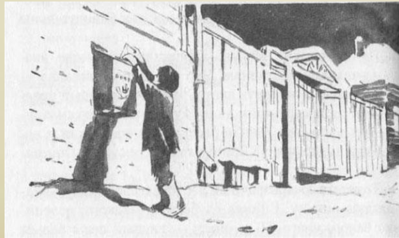
Кукрыниксы. Заставка к рассказу А. П. Чехова "Ванька".