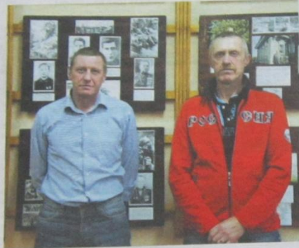
Братья Холины постоянно приходят на встречи с учениками в Юрьевскую школу

маневренной группы заключалась в сопровождении колонны. Кому-то может показаться, что служба простая. Но в военных условиях всё по-другому: неизвестно, вернешься или нет. Дороги в Афганистане извилистые, узкие, в одну машину. Колонна в