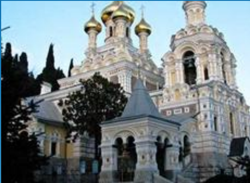
Александр-Невский собор в Ялте