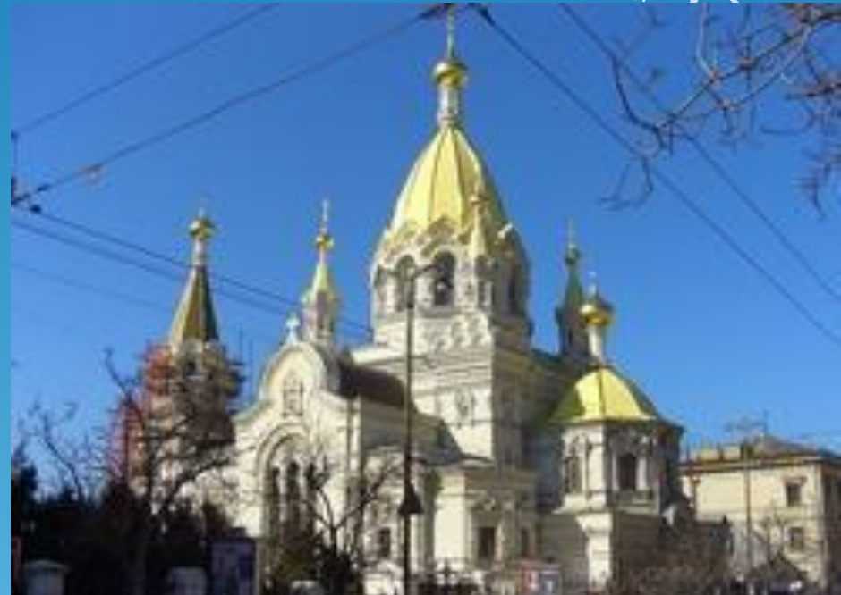
Покровский собор в Севастополе