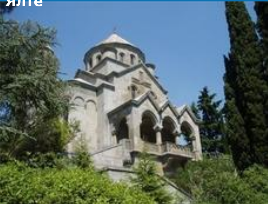
Монастырь Сурб- Хач