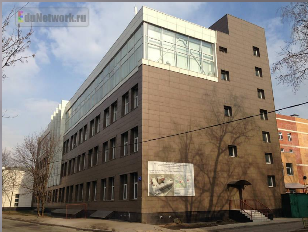
Московский государственный академический художественный институт имени В.И. Сурикова при Российской академии художеств