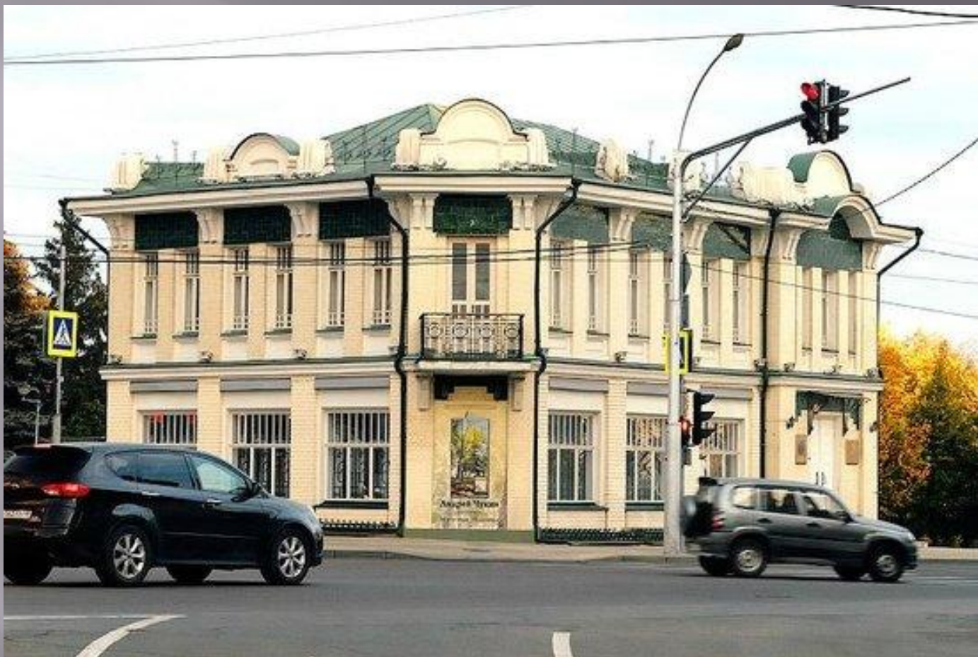
Художественный музей им. В.С. Сорокина на улице Ленина