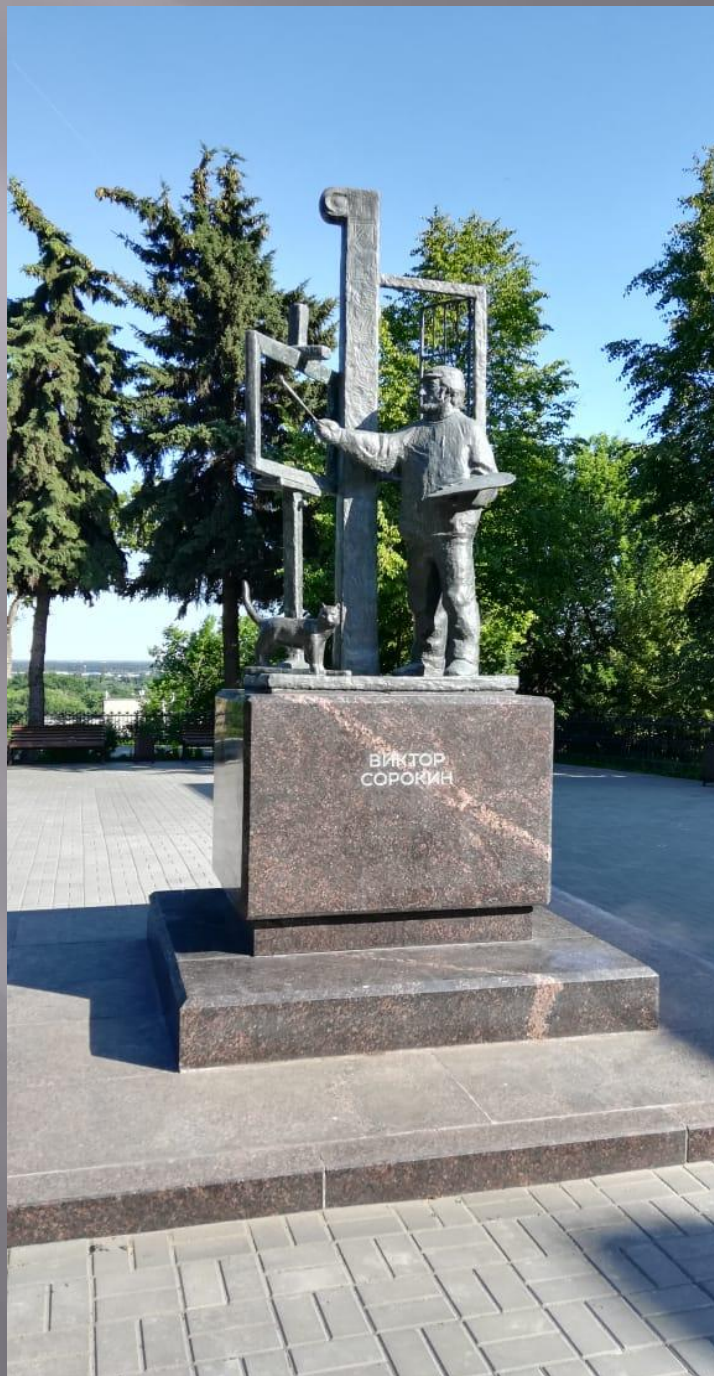
Памятник В. Сорокину на ул. Ленина