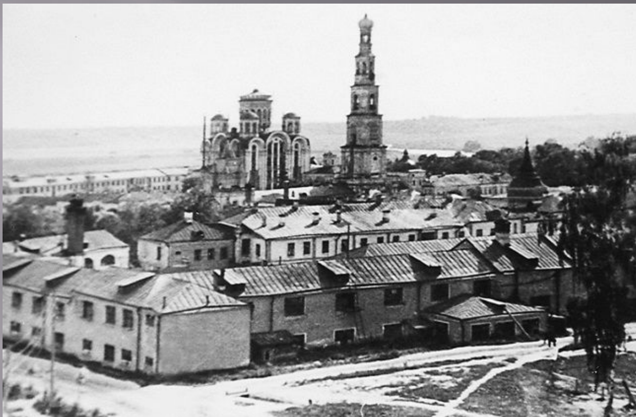
Трудовая коммуна им. Ф. Э Дзержинского при Николо-Угрешском монастыре