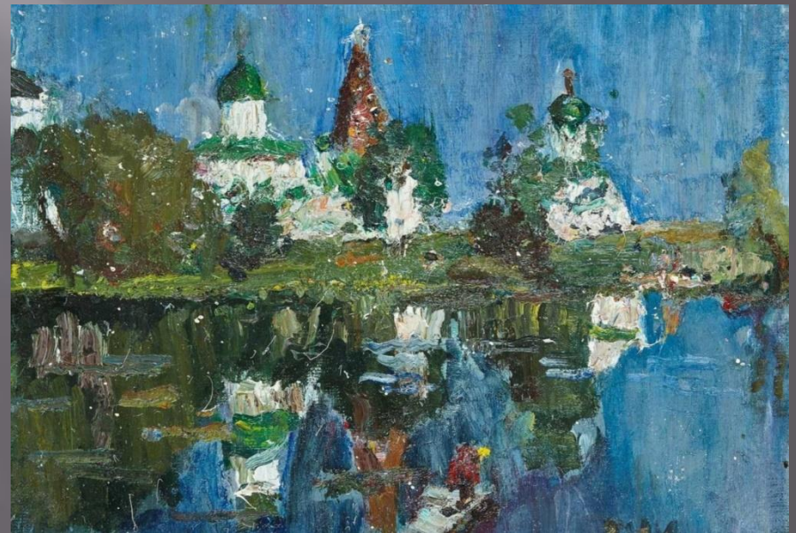
Донской монастырь 1988 г.