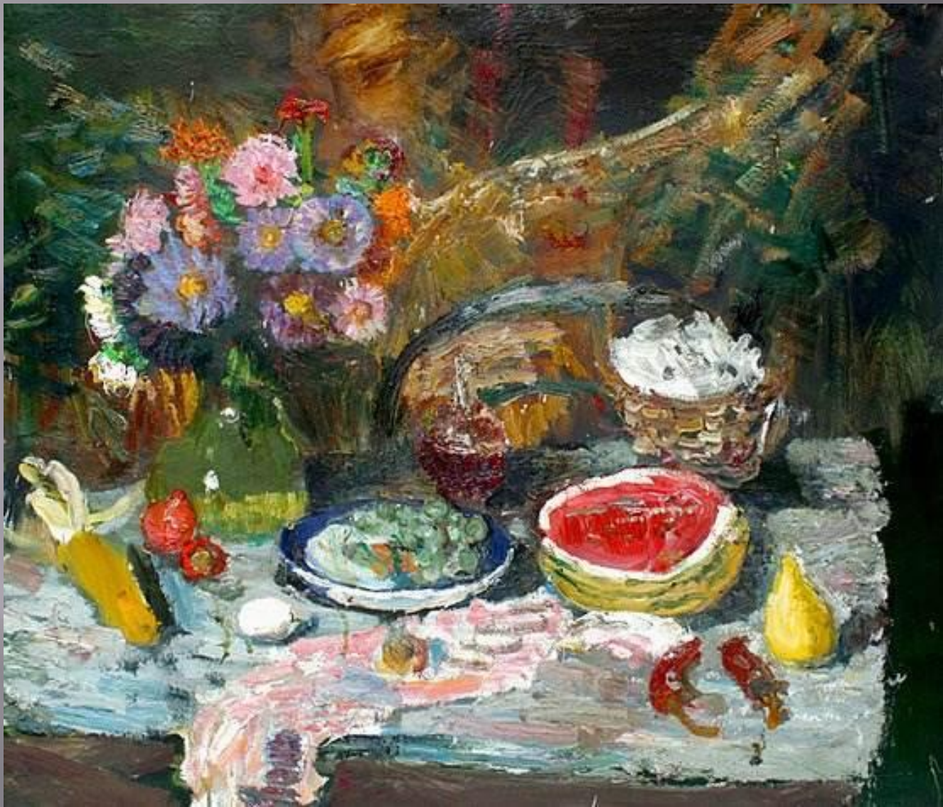
Натюрморт с арбузом, 1989 г.