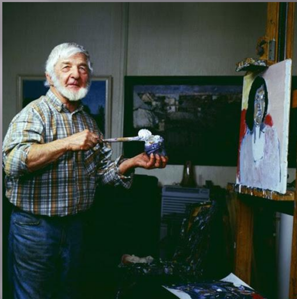
Виктор Семёнович Сорóкин (25 декабря 1912 — 25 августа 2001) — Народный художник РСФСР (1991), Заслуженный художник РСФСР (1976). Кавалер Ордена Почёта (1998)[1]