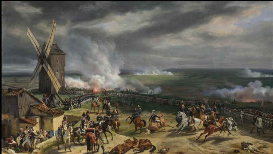
Битва при Вальми