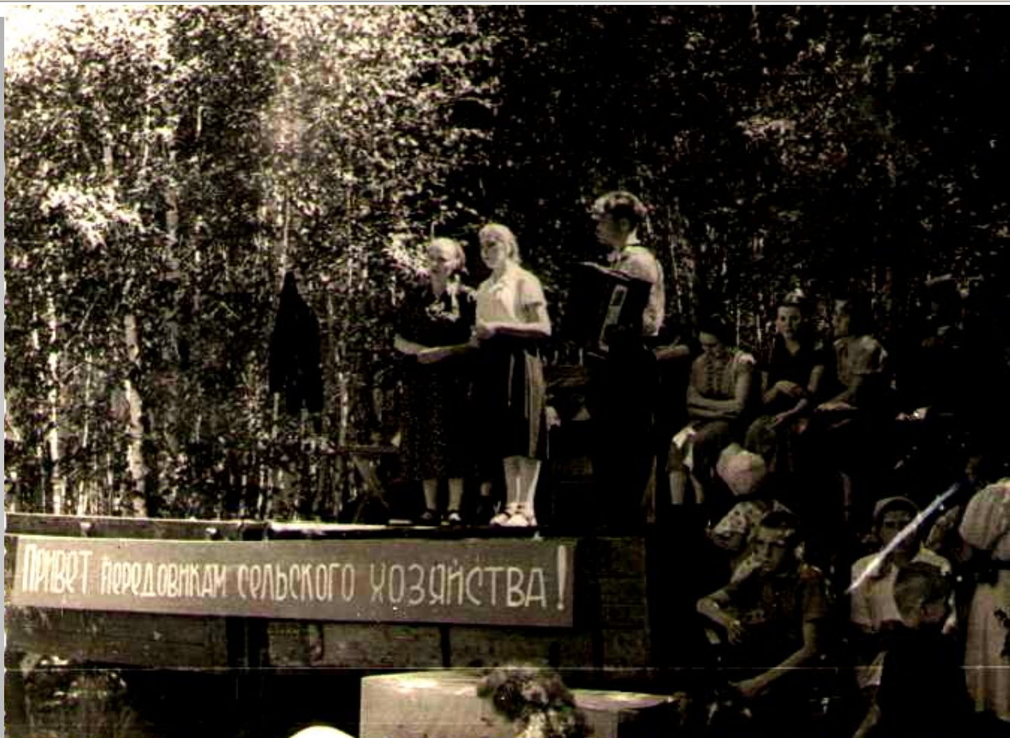
Праздник сельского хозяйства, 1965 год