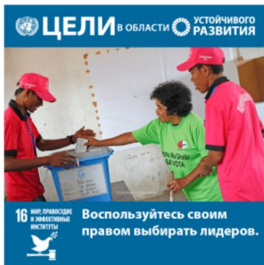
Цель 16: Мир, правосудие и эффективные институты