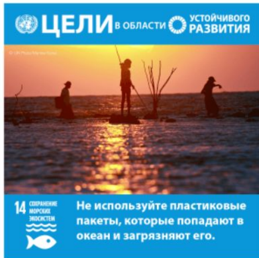
Цель 14: Сохранение морских экосистем