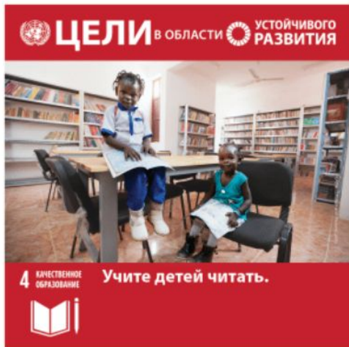
Цель 4: Качественное образование