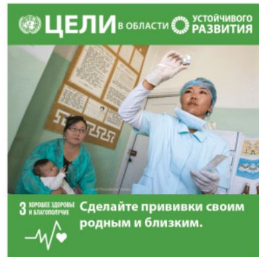
Цель 3: Хорошее здоровье и благополучие