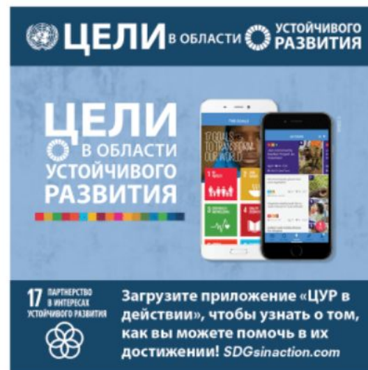
Цель 17: Партнерство в интересах устойчивого развития