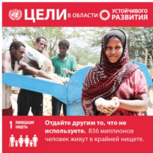
Цель 1: Ликвидация нищеты