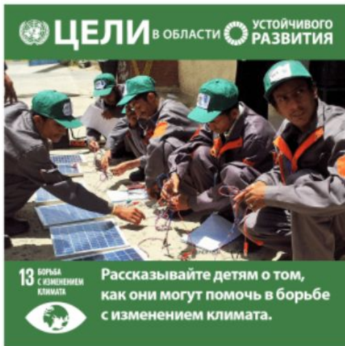
Цель 13: Борьба с изменением климата