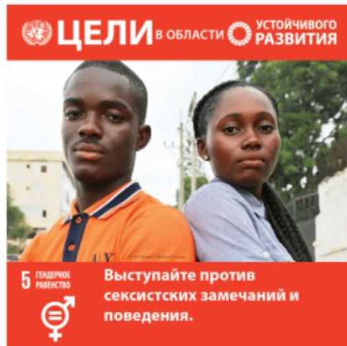
Цель 5: Гендерное равенство