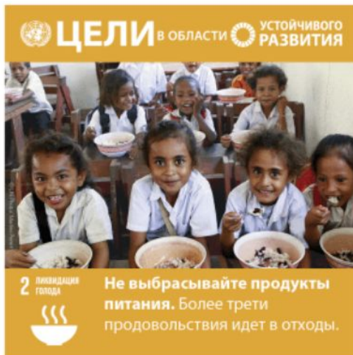
Цель 2: Ликвидация голода