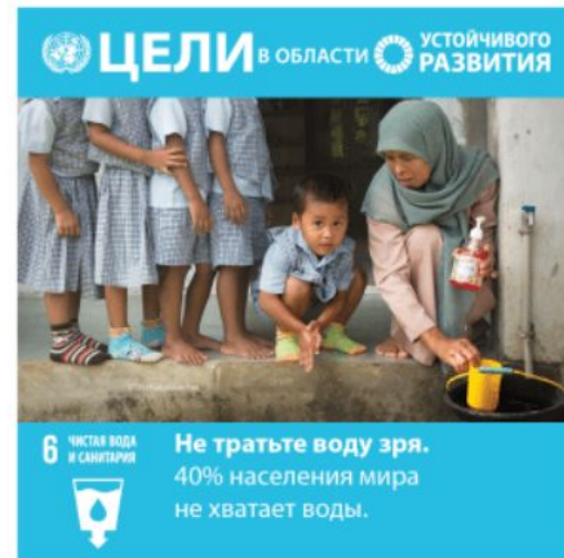
Цель 6: Чистая вода и санитария