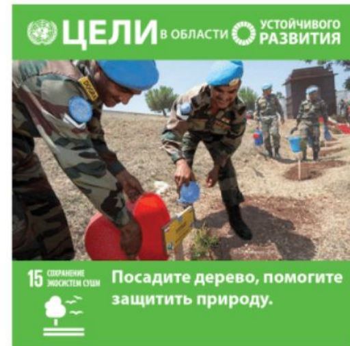
Цель 15: Сохранение экосистем суши