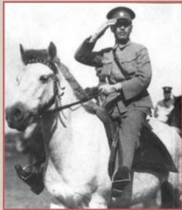
Чан Кайши в 1926 г.

В период Северного похода значительно возросло влияние КПК, численность которой в 1927 г. достигла почти 25 тыс. человек. Это обстоятельство было воспринято правыми как сигнал для обуздания коммунистов. В апреле 1927 г. по приказу Чан Кайши в Шанхае были осуществлены антикоммунистические акции. Расправы с коммунистами произошли и в других городах. Эти события положили начало кризису революции и единого фронта. В июле этого же года Центральный исполнительный комитет Гоминьдана принял решение о разрыве с КПК. В феврале 1928 г. Национальное правительство Китая в Нанкине возглавил Чан Кайши, который и завершил северный поход и объединение Китая. Вскоре гоминьдановское правительство было признано великими державами как общекитайское.