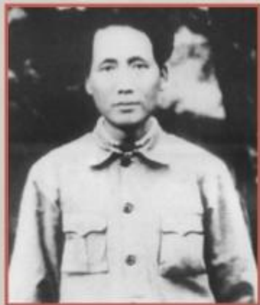
Мао Цзэдун. 1931 г.

На стыке провинции Цзянси и запада провинции Фуцзянь возник Центральный советский район. 7 ноября 1931 г. здесь было провозглашено создание Китайской Советской Республики, главой и председателем правительства которой был избран Мао Цзэдун.