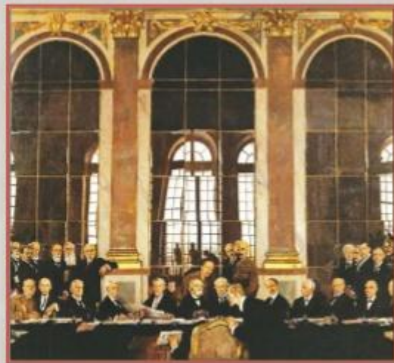
Парижская мирная конференция. Версаль. Зеркальный зал. 1919 г.

В период хаоса и беспорядков в Китае усилилось влияние иностранных держав. Европейские, американские и японские коммерсанты, миссионеры и солдаты были хозяевами в китайских открытых для торговли портовых городах. В 1915 г. новое давление на своего когда-то могущественного соседа оказала Япония. В самый разгар Первой мировой войны Япония направила Юань Шикаю 21 требование с целью превращения Китая в японский протекторат. Слишком слабый, чтобы сопротивляться, Юань Шикай принял часть требований. В 1919 г. на Парижской мирной конференции державы-победители предоставили Японии контроль над германскими владениями в Китае, который они фактически рассматривали как полуколониальное государство. Это решение привело в негодование китайских националистов.