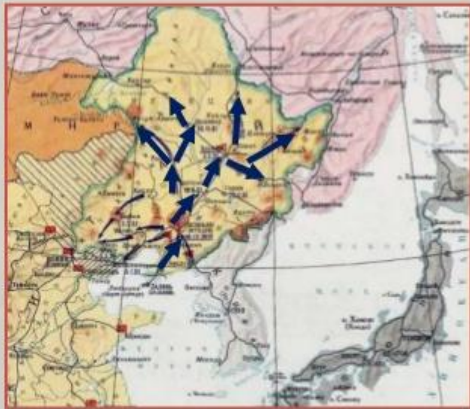
Японская агрессия в Маньчжурии. 1931-1932 гг.

В то время как Чан Кайши преследовал коммунистов по всему Китаю, страна столкнулась с ещё одной угрозой. В 1931 г. Япония вторглась в Маньчжурию и захватила её. В стране развернулось массовое антияпонское движение. Даже гоминьдановские генералы были недовольны тем, что Национальное правительство в Нанкине растрачивало драгоценные ресурсы, сражаясь с китайцами-коммунистами, вместо того чтобы мобилизовать всех на борьбу против японских завоевателей. В конце 1935 г. ЦК КПК провозгласил курс на создание единого антияпонского фронта, а в мае 1936 г. Мао Цзэдун предложил нанкинскому правительству прекратить гражданскую войну. Но Чан Кайши не спешил, несмотря на нараставшие в обществе патриотические антияпонские настроения.