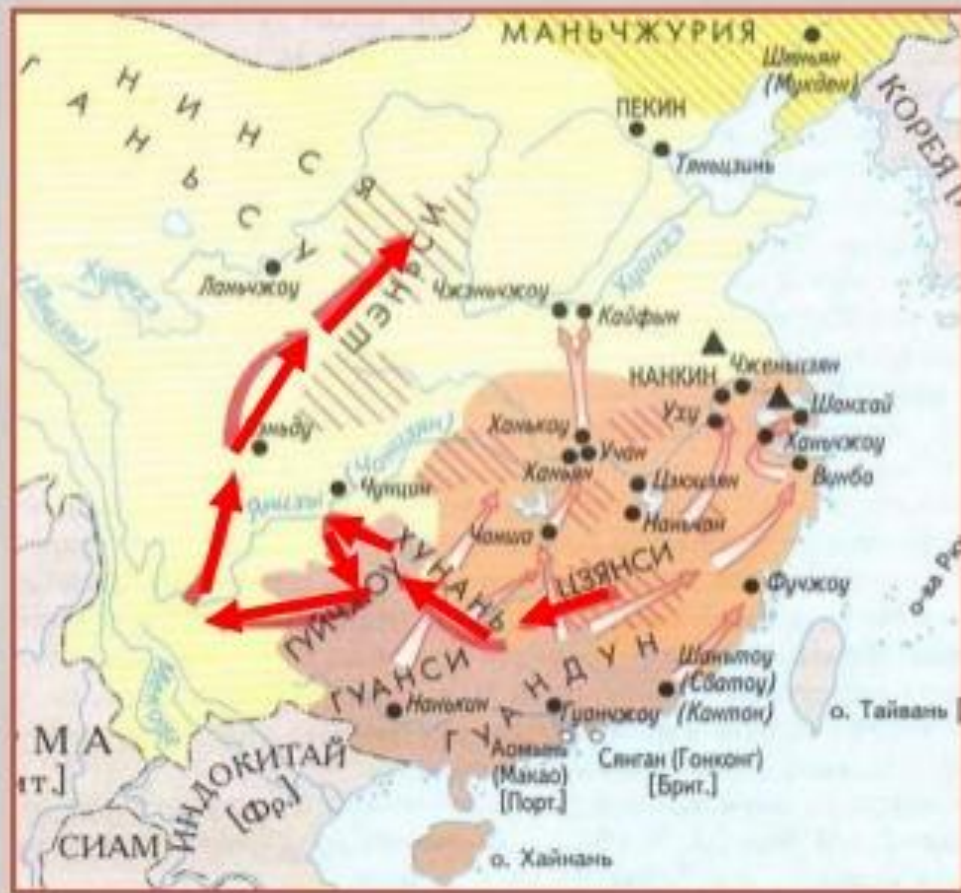
Китай в 1924-1937 гг.

Только 5-й поход в Центральный район, предпринятый Чан Кайши в 1934 г., стал успешным. Красная армия оказалась в окружении гоминьдановских войск. Единственным выходом был прорыв окружения и оставление Центрального района. Начался Великий поход Красной армии на северо-запад страны, стоивший огромных людских потерь. Великий поход стал символом героической борьбы китайских коммунистов против Гоминьдана. Мао Цзэдун сравнивал этот поход с сеялкой, посеявшей «множество семян в 11 провинциях» Китая: «Семена пустят ростки, дадут листья, цветы, и плоды принесут урожай в будущем». Спустя 2 года в провинции Шаньси была создана новая революционная база КПК.