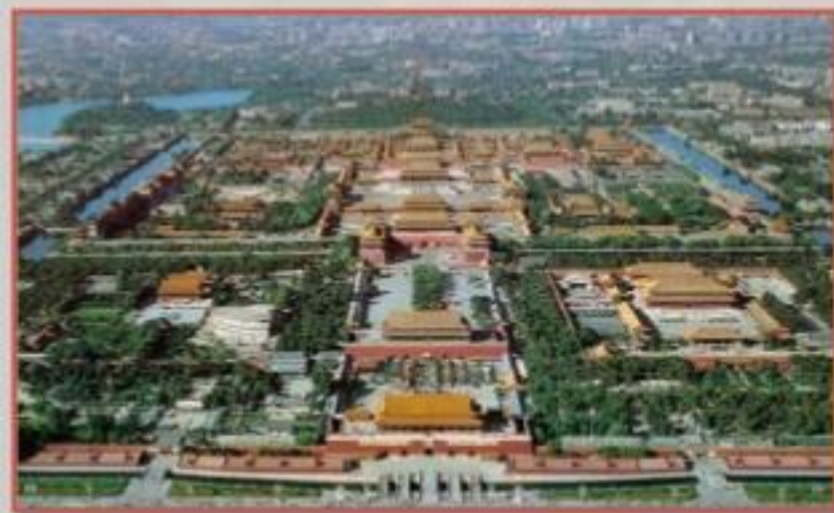
Императорский дворец Гугун в Пекине