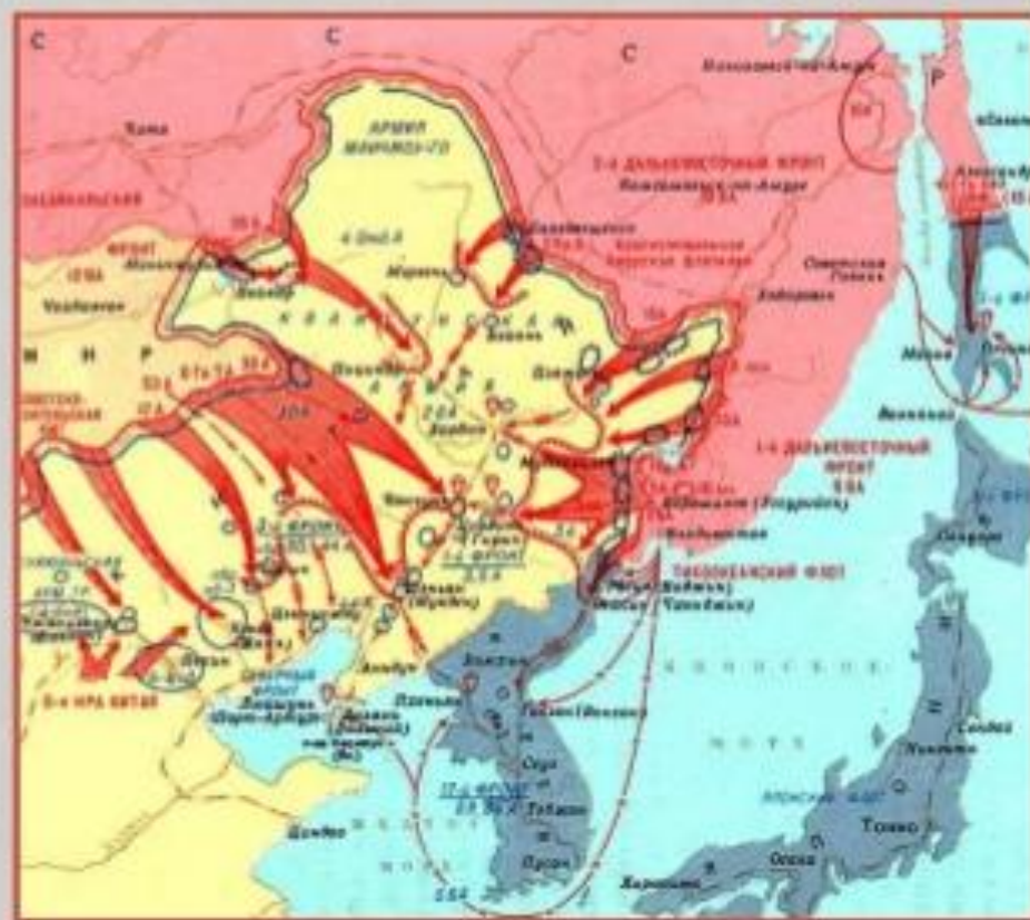
Разгром Квантунской армии Японии. 9 августа - 2 сентября 1945 г.

В ходе японо-китайской войны позиции Гоминьдана заметно ослабли, в то время как позиции КПК укрепились. В августе 1945 г. войска СССР разгромили японскую Квантунскую армию в Маньчжурии. Вступление советских войск на территорию Китая во многом повлияло на послевоенное развитие событий в стране. Гражданская война между Гоминьданом и КПК возобновилась. Спустя несколько лет коммунисты, одержав победу, приступили к социалистической модернизации Китая.