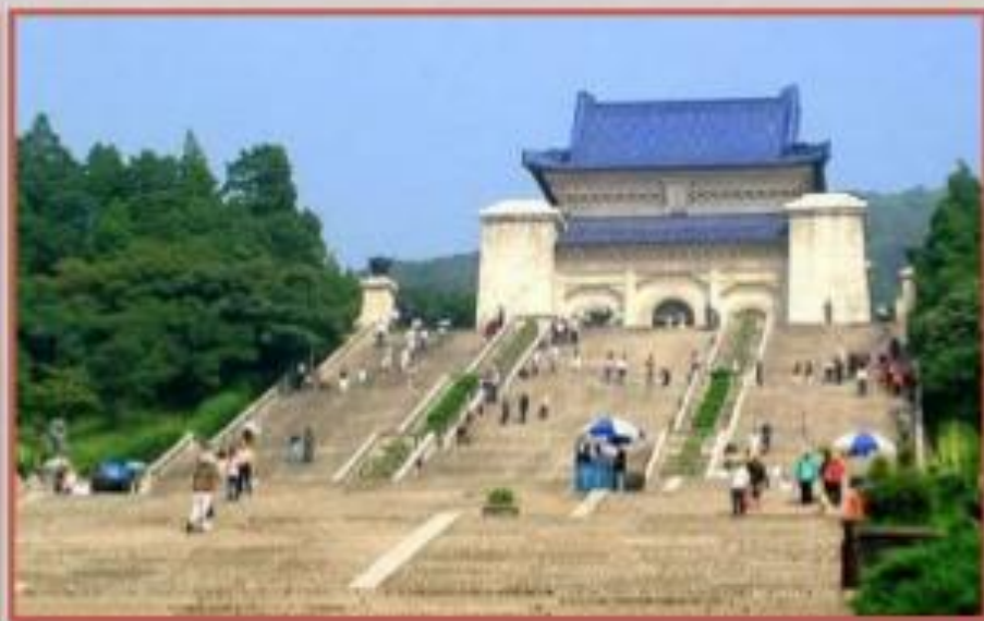
Мавзолей Сунь Ятсена в Нанкине

В архитектуре и скульптуре Китая доминировали старые средневековые формы, являвшиеся частью культового искусства. В 1925 г. открылся музей Гугун в Пекине, включавший дворцы и павильоны бывшего императорского Запретного города. В 1929 г. в Нанкине был построен величественный мавзолей Сунь Ятсена, внутри которого установили скульптуру вождя Гоминьдана.