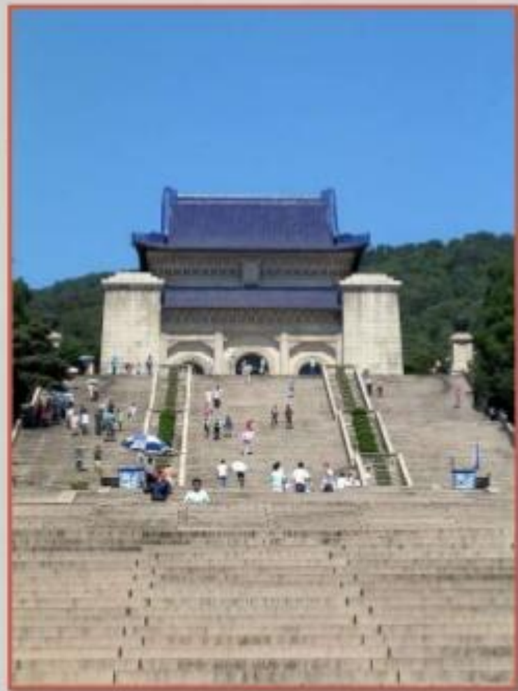
Мавзолей Сунь Ятсена в Нанкине

В марте 1925 г. умер Сунь Ятсен. В соответствии с его завещанием союз между националистами и китайскими коммунистами с ориентацией на СССР сохранился. Но правые в Гоминьдане были встревожены размахом народных движений, в т.ч. выступлениями рабочих Шанхая, Гуанчжоу и Гонконга против международных концессий, созданием крестьянских союзов, направленных против помещиков-землевладельцев.