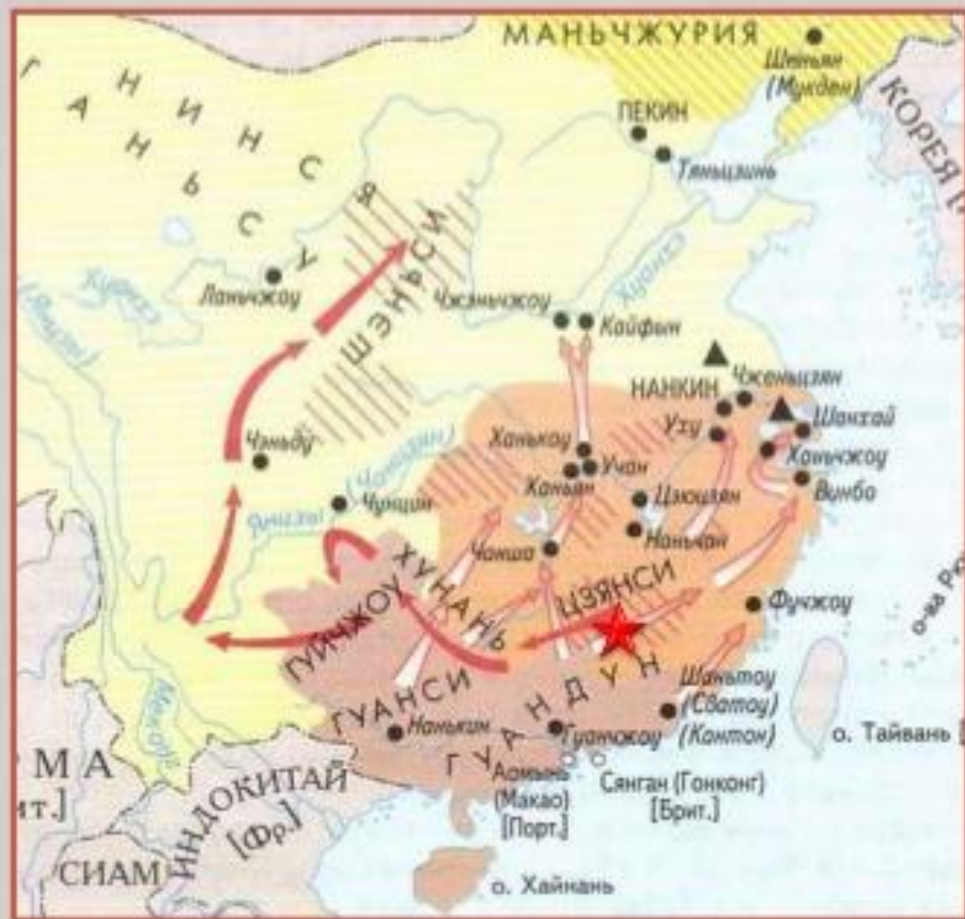
Китай в 1924-1937 гг.

На стыке провинции Цзянси и запада провинции Фуцзянь возник Центральный советский район. 7 ноября 1931 г. здесь было провозглашено создание Китайской Советской Республики, главой и председателем правительства которой был избран Мао Цзэдун.