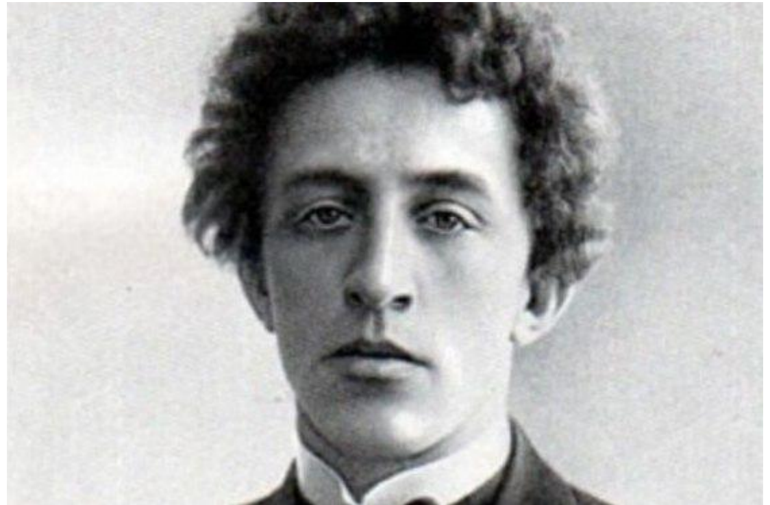
АЛЕКСАНДР БЛОК. 1902 ГОД.