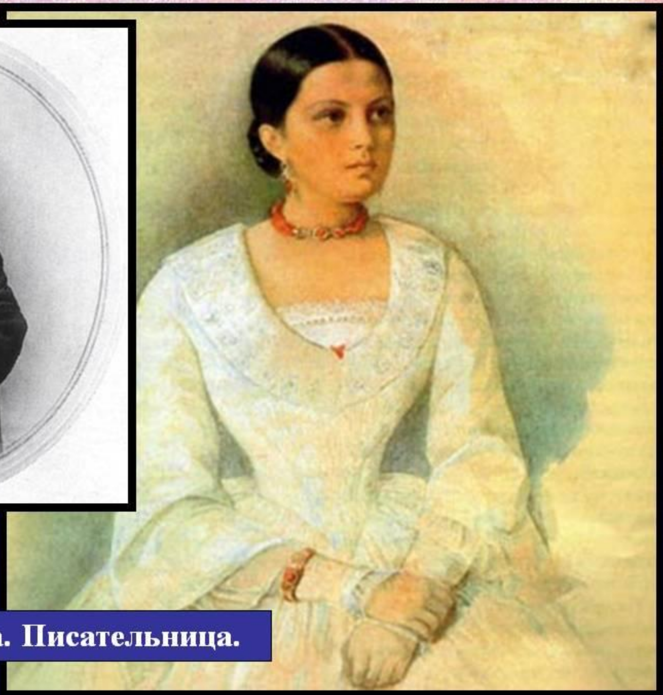
А. Я. Панаева. Писательница.