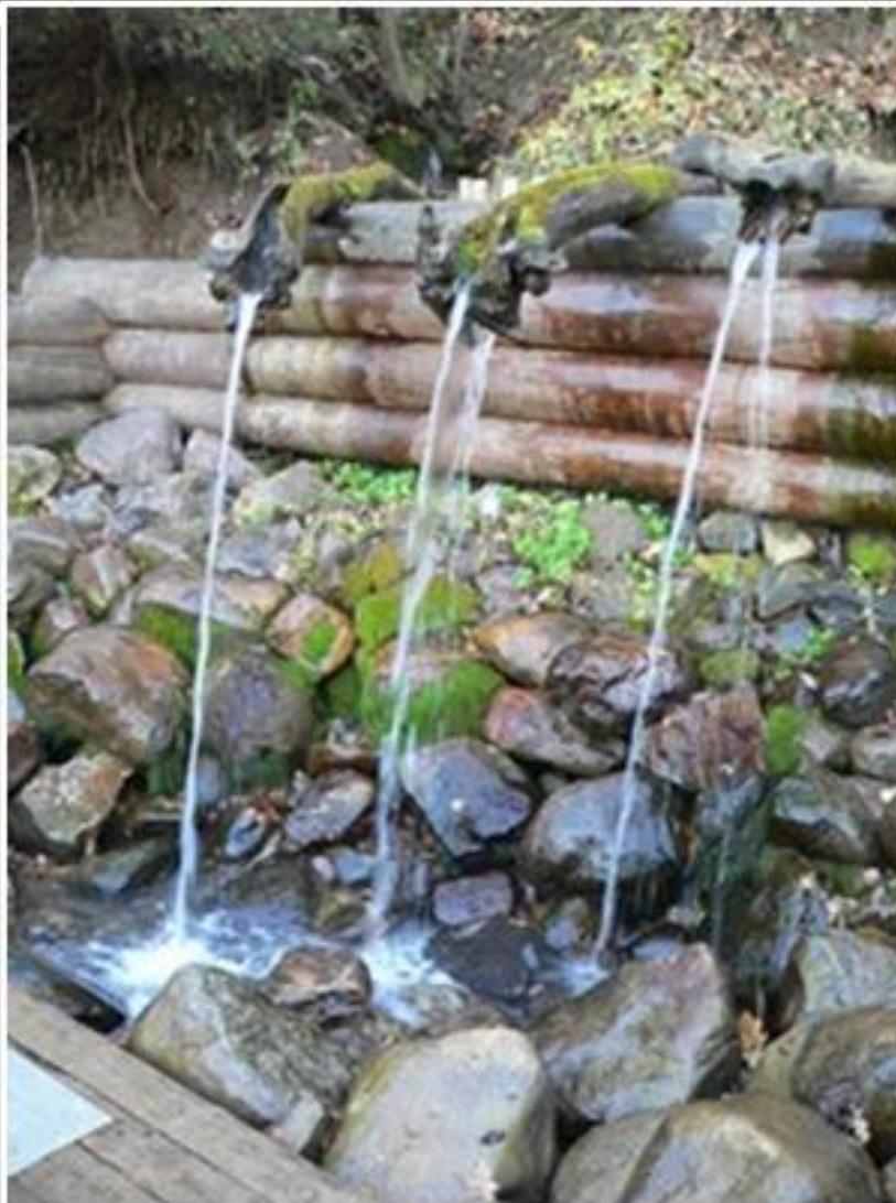
Святой источник преподобного Сергия Радонежского