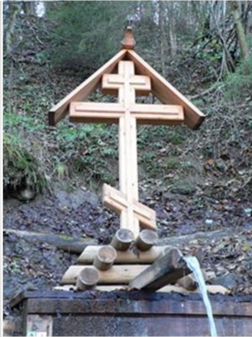
Крест над святым источником