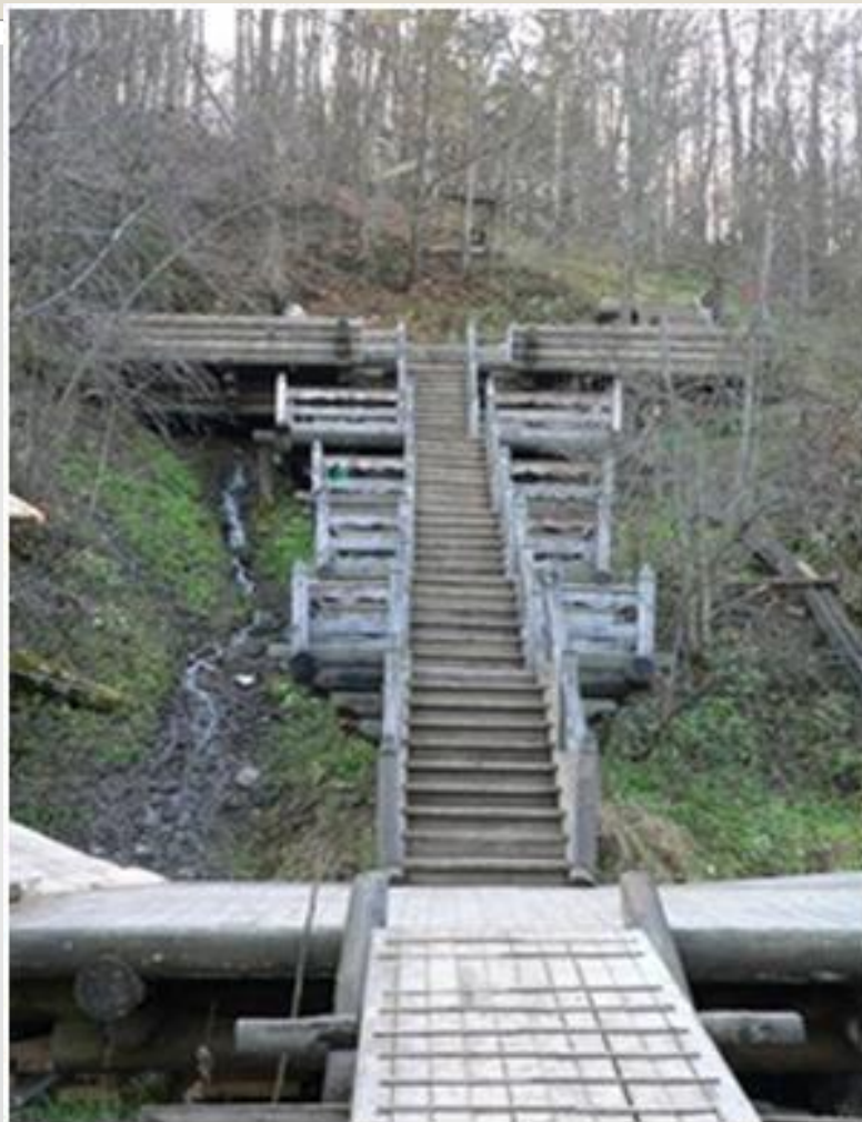
Гремячий ключ. Лестница к водопаду