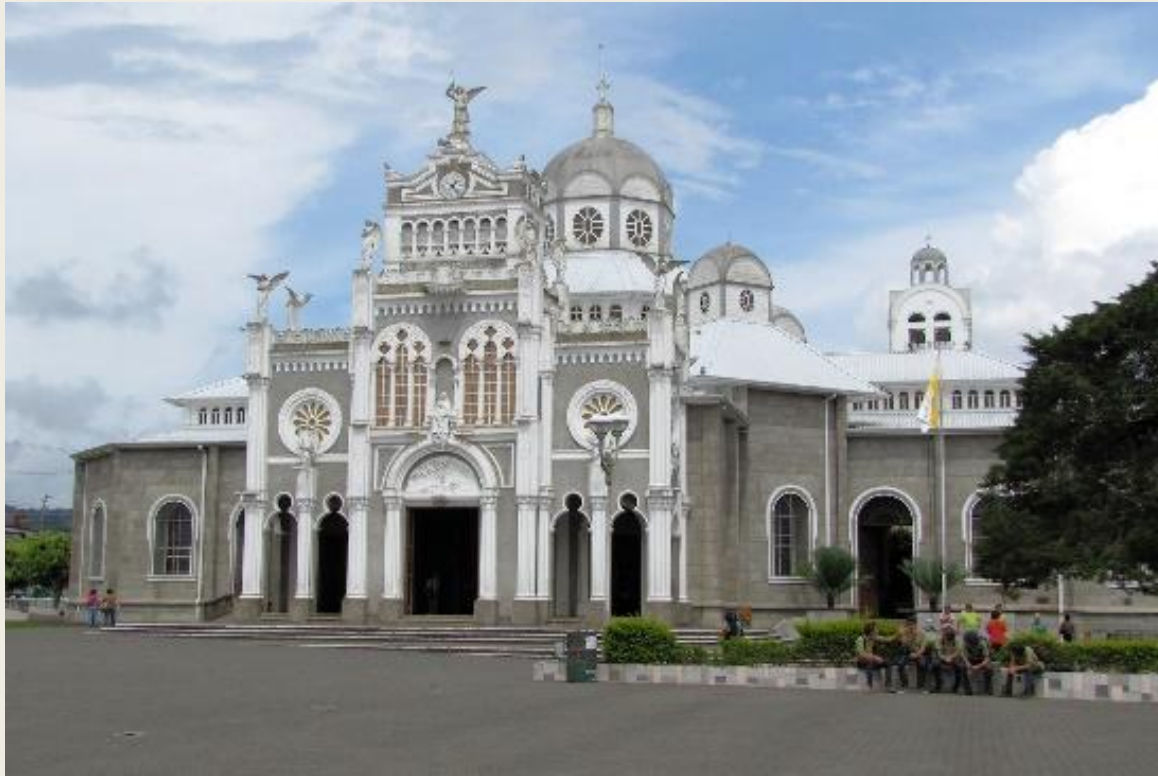
Собор Богоматери Ангелов

Культура Коста-Рики определяется смешением многовекового испанского влияния и традициями древних индейских народов. Это проявляется в различных аспектах: от языка до архитектуры исторических построек и церквей. Свыше 80% населения являются потомками испанских эмигрантов. Несмотря на длительную европеизацию костариканцев, коренное влияние древних народов незримо присутствует в кулинарии или традициях изготовления керамических изделий.