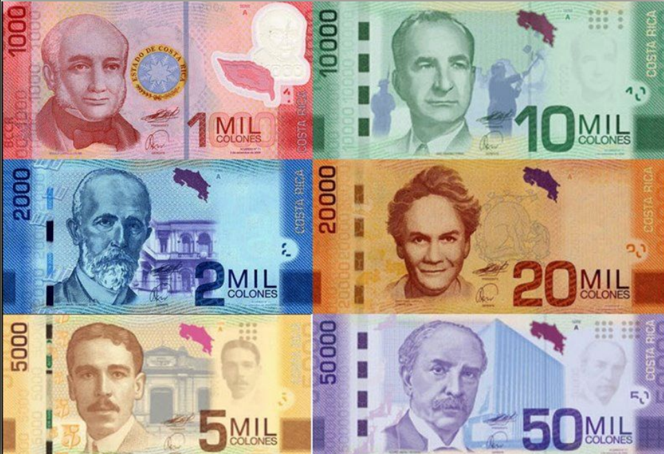
Действующие банкноты Коста-риканского колона