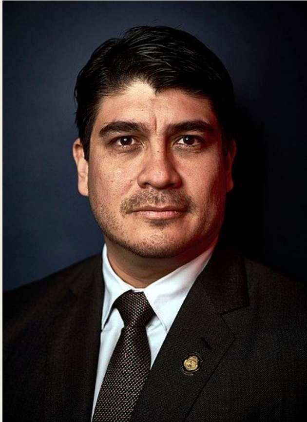
Альварадо Кесада, Карлос

Коста-риканский писатель, журналист, политолог, политик и президент Коста-Рики. Ранее он занимал пост министра труда и социальной защиты. Альварадо имеет степень бакалавра в области коммуникаций и степень магистра в области политологии Университета Коста-Рики, а также магистерский диплом Сассекского университета. Представляет левоцентристскую партию «Гражданское действие».