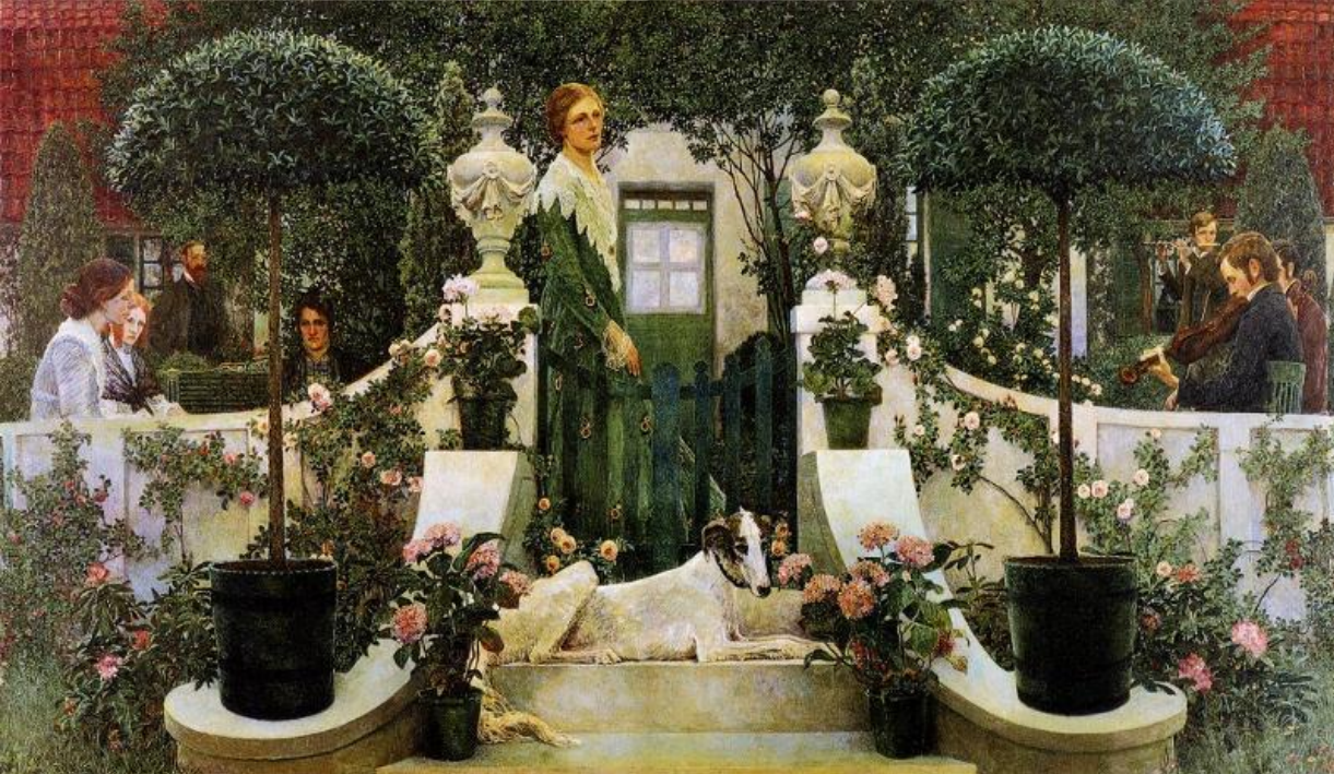
Генрих Фогелер, Концерт (Летний вечер) , 1905

Дом художника — знаменитый „Баркенхофф“, перестроенный из крестьянской хижины, в начале XX столетия был подлинным духовным центром ворпсведской колонии. В нем встречались знаменитые литераторы и издатели, художники и музыканты. Долгое время гостем Фогелера был Р. М. Рильке, которого связывала с художником тесная дружба. „Баркенхофф“ был и очагом семейного счастья Фогелера, многие картины и офорты мастер посвятил жене, дочерям и друзьям, часто он изображал и свой дом. „Моя хижина для меня — все“, — писал художник. Сюжетом центральной работы раннего периода творчества и одного из важнейших произведений Югендстиля, картины „Концерт (Летний вечер)“, стали знаменитые музыкальные вечера в доме Фогелера.