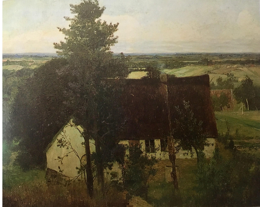
Генрих Фогелер, Дом художника, 1897 Галерея Новые мастера (Дрезден)

Макензен организовал для Фогелера занятия живописью, а Ам Энде обучил его искусству офорта. Зимой 1895 года, завершив обучение, Фогелер переселился в Ворпсведе. Несколькоими месяцами ранее умер его отец, фирма была продана, и на свою часть наследства художник купил крестьянский дом.