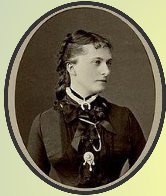
Портрет Екатерины Долгоруковой