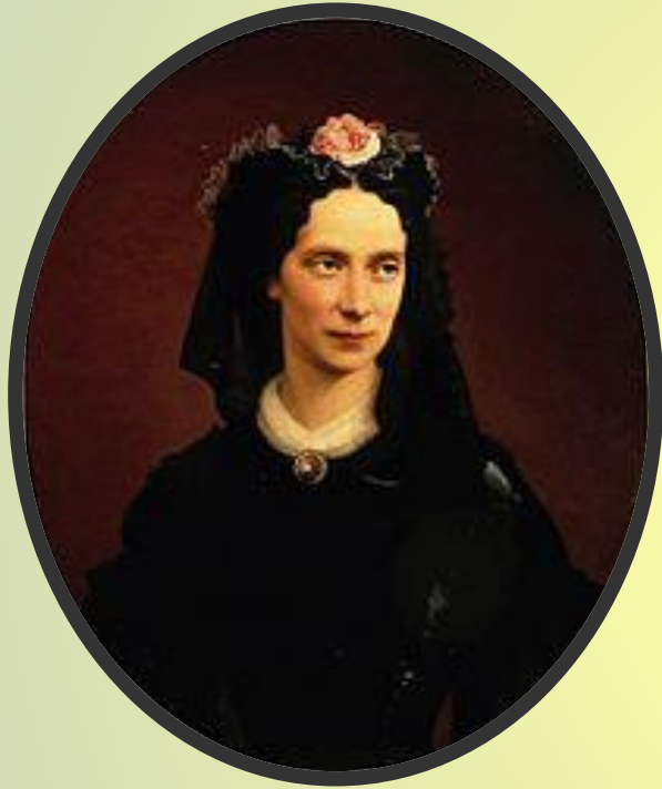
Портрет императрицы Марии Александровны