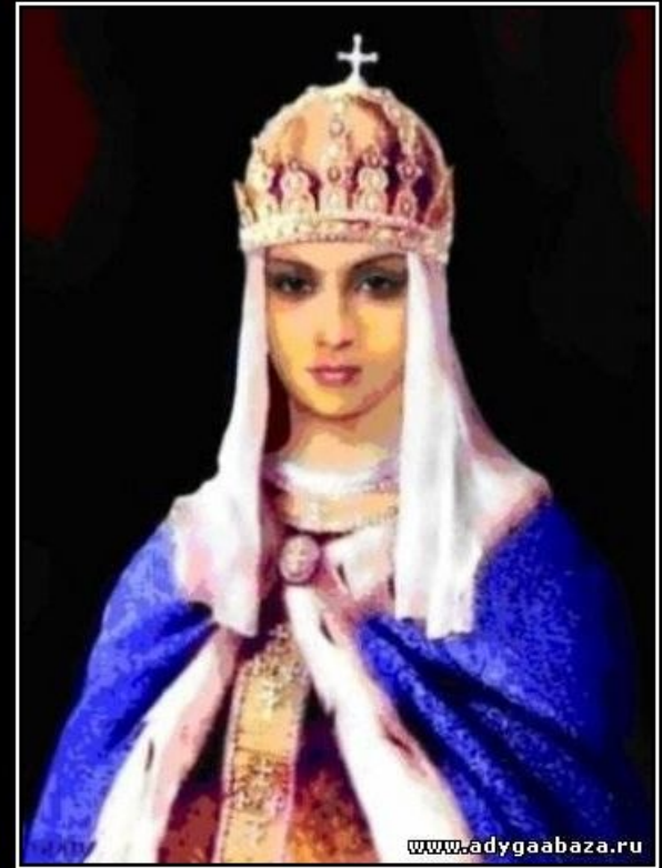
Мария Темрюковна (до крещения Кученей)