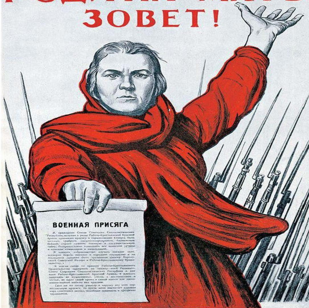
Плакат «Родина-мать зовет!» Художник И.М. Тоидзе. 1941 г.