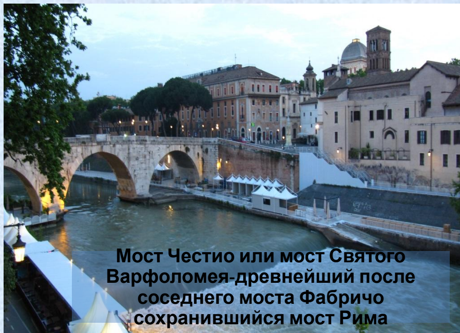
Мост Честио или мост Святого Варфоломея-древнейший после соседнего моста Фабричо сохранившийся мост Рима