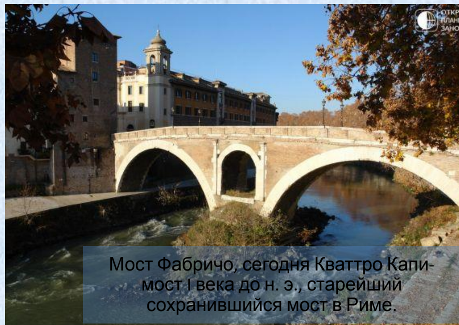
Мост Фабричо, сегодня Кваттро Капи-мост I века до н. э., старейший сохранившийся мост в Риме.