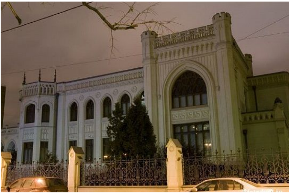
Особняк Саввы Морозова