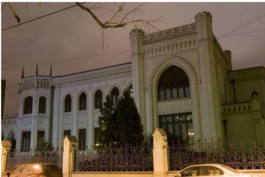
Особняк Саввы Морозова