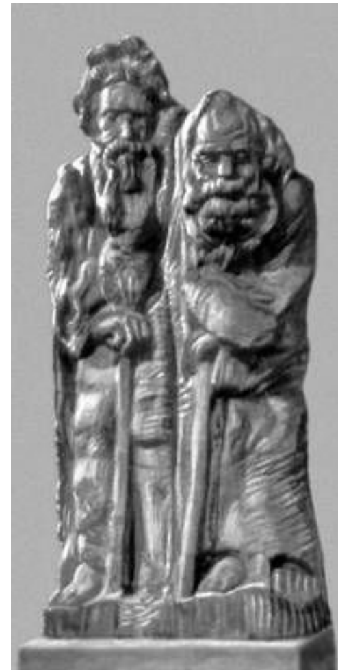
«Нищая братия». Дерево. 1917.