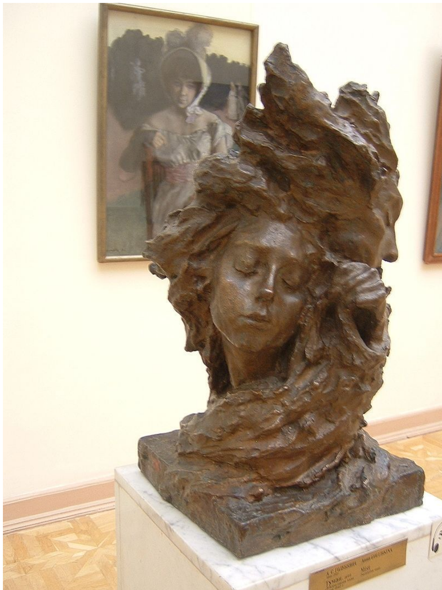
Ваза "Туман", 1899