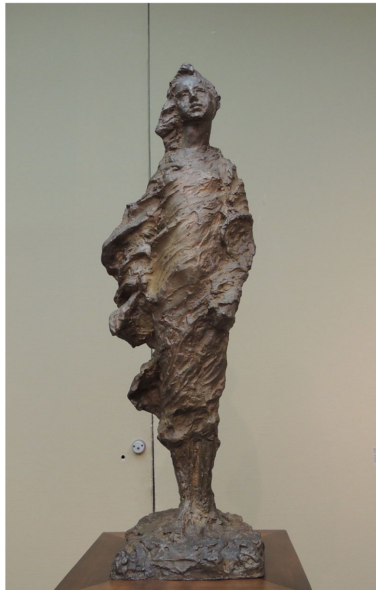
Березка, 1927 (последняя работа мастера)