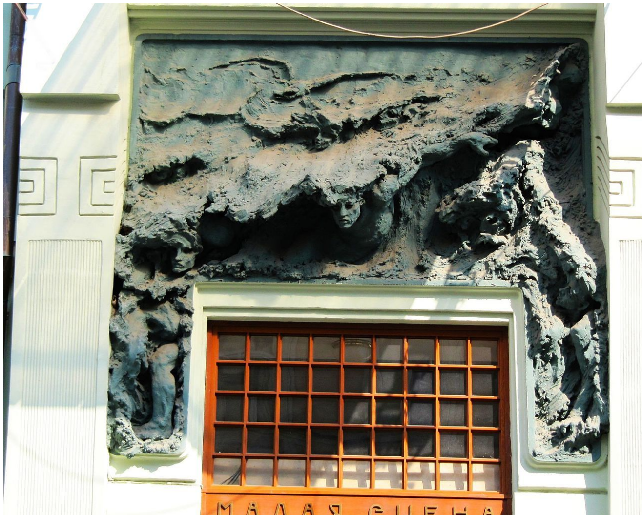
Рельеф «Пловец» над входом в МХАТ