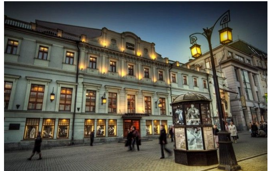
МХТ им. А. П. Чехова