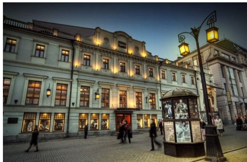
МХТ им. А. П. Чехова