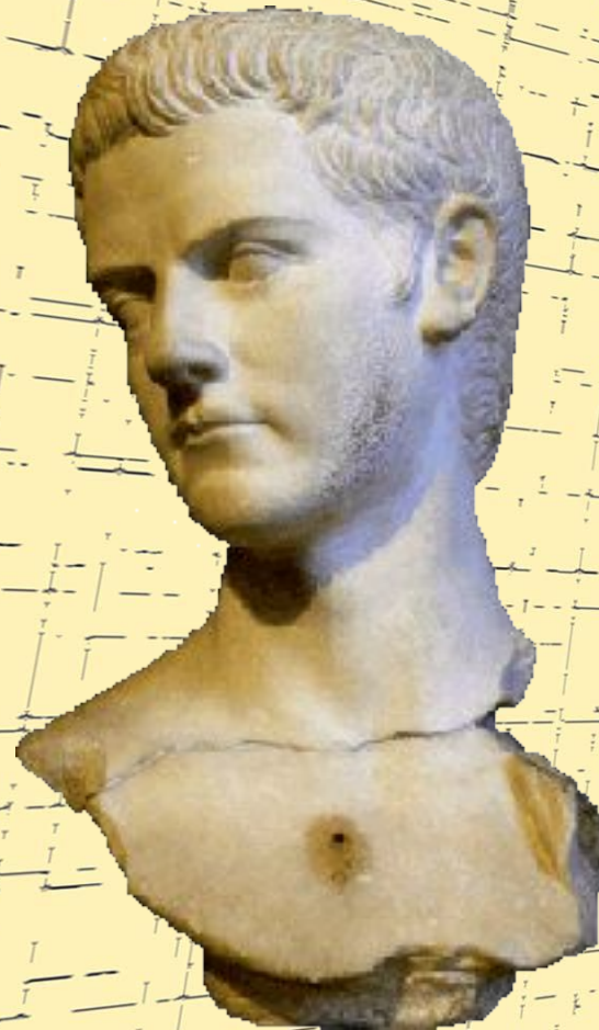
Калигула (Лувр) (37-41 гг.)