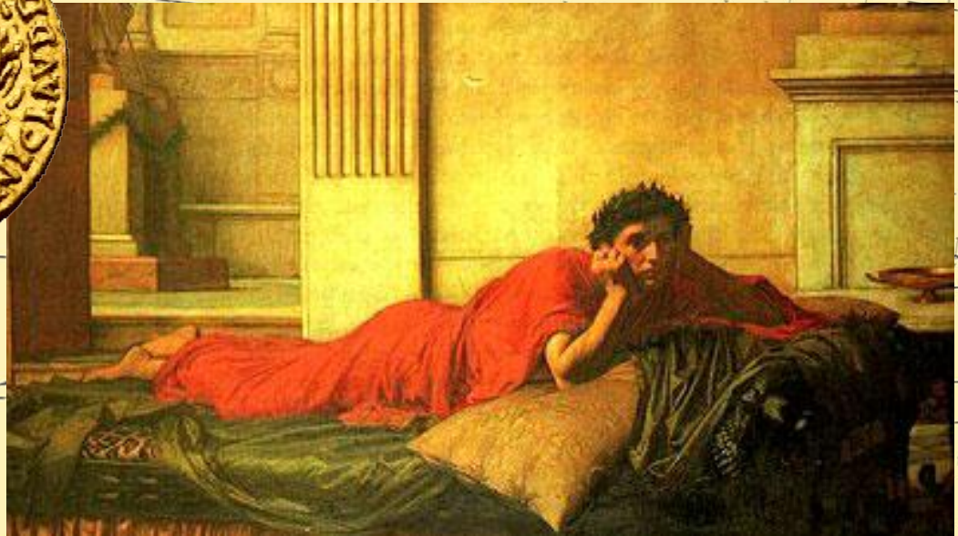
Джон Уильям Уотерхауз. Нерон мучается от угрызений совести после убийства матери (1878 г.)