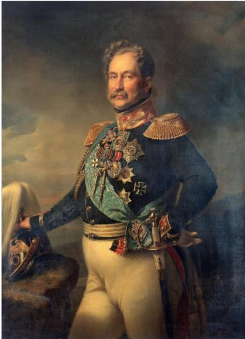
Князь А.Ф. Орлов