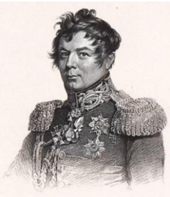
Иван Иванович Дибич- Забалканский