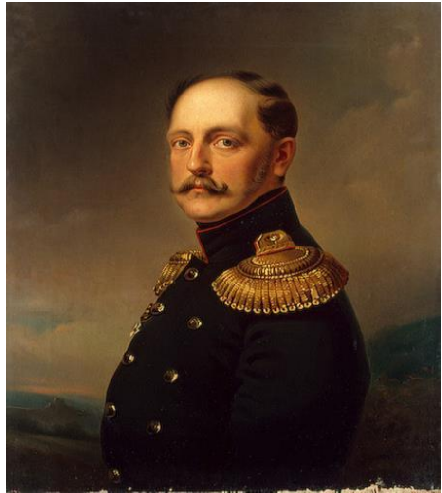
Император Николай I (1825-1855 гг.)

«Где раз поднят русский флаг, там он уже опускаться не должен»