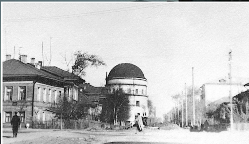
ул. Батюшкова наше время