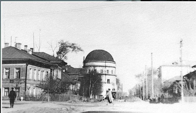
ул. Батюшкова 1925 год