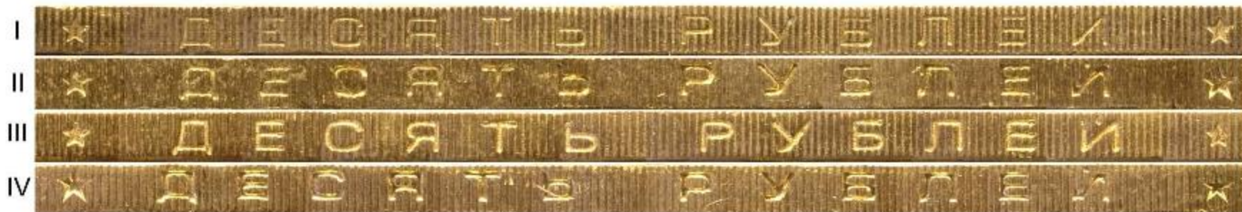
Гурты 10-рублевых монет

Боковая поверхность (ребро) монеты называется гуртом. Большинство монет имеют традиционный рифленый, реже — гладкий гурт. Иногда на гурт монеты наносят надписи.