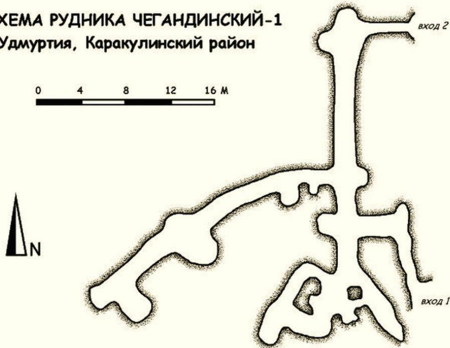
СХЕМА РУДНИКА ЧЕГАНДИНСКИЙ-1 Удмуртия, Каракулинский район

Кроме этого изучением пещер занимается группа исследователей таинственных мест Удмуртии «Сфера-Х» под руководством Валерия Котова. Они регулярно проводят раскопки в пещерах, очищают выход от песка. Они обнаружили в пещерах патроны от ружей. Также они обнаружили остатки трех печей. Предположили что это печи по выплавке меди. Был обнаружен осколок снаряда. Они считают что это остаток от бомбы которую взорвали в пещере в Гражданскую войну