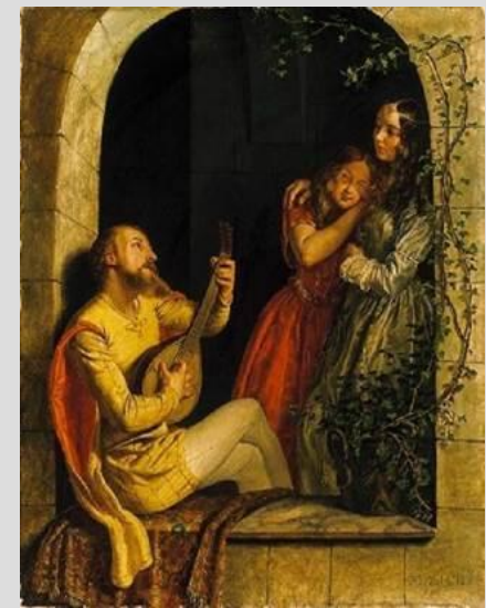
Рис. 4. Средневековый трубадур

Культура аристократии представлена любовными стихами трубадуров (Рис. 4), рыцарскими поэмами о героях круглого стола. Здесь мы видим образ человека, который, с одной стороны, бесстрашен и силен, а с другой стороны, это прекрасный кавалер, который может служить даме, слагать стихи, играть в интеллектуальные игры и т.д. Это культура воинской доблести и высоких нежных чувств.