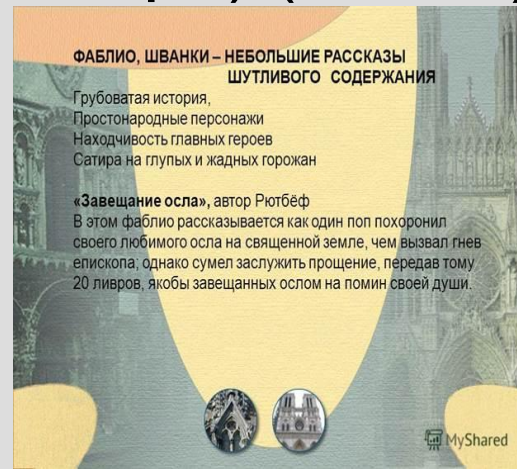
Рис. 5. Фаблио и шванки

Культура горожан представлена в виде фаблио (один из жанров французской городской литературы XII – начала XIV в. Это небольшие стихотворные новеллы, целью которых было развлекать и поучать слушателей) и шванков (жанр немецкой городской средневековой литературы, небольшой юмористический рассказ в стихах, часто сатирического и назидательного характера) (Рис. 5).