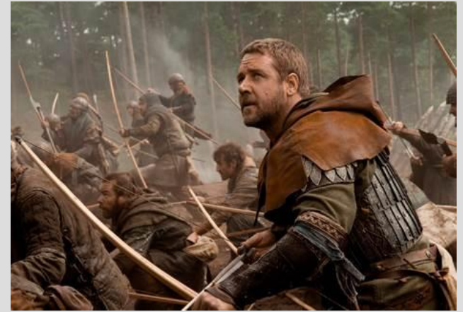
Рис. 8. Робин Гуд (кадр из х/ф «Робин Гуд», 2010)