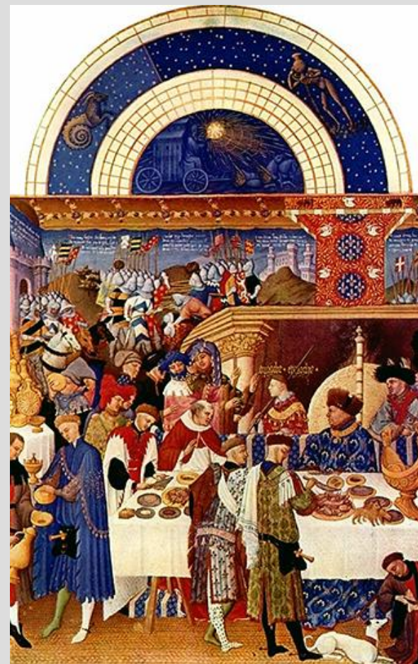
Роскошный Часослов герцога Жана Беррийского». 1412-1416 гг.