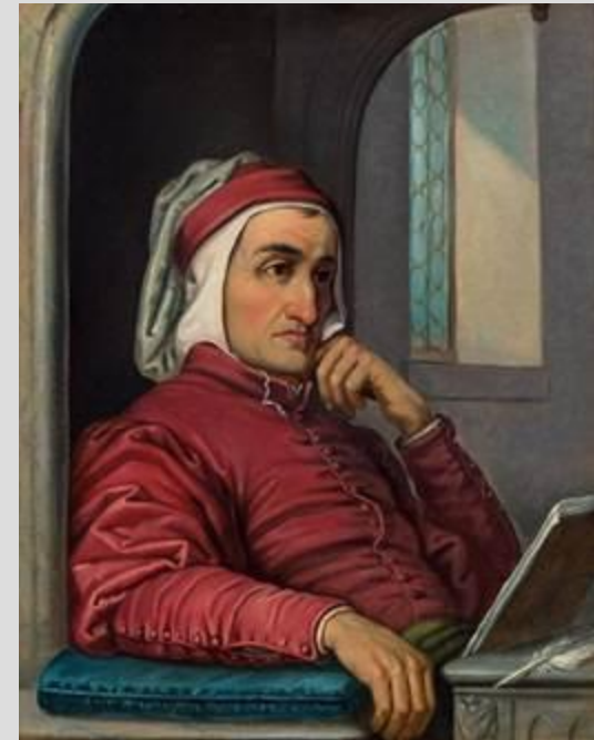
Рис. 11. Портрет Данте Алигьери