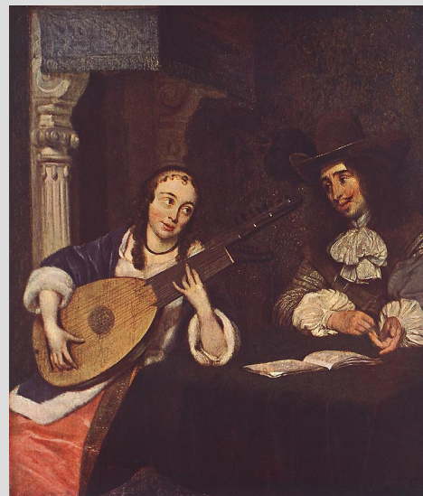
Герард Терборх. Женщина играет на лютне.