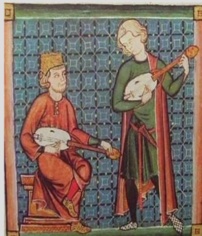
Рис. 1. Средневековый фольклор

Вся культура Средневековья делится на культуру безмолвствующего большинства (в основном жители деревни) и культуру грамотного, образованного меньшинства. Культура большинства представлена в виде фольклора (Рис. 1), но от этой культуры мало что сохранилось, так как большинство людей в то время не умело писать. Грамотное меньшинство владело латынью – универсальным языком Средневековья.