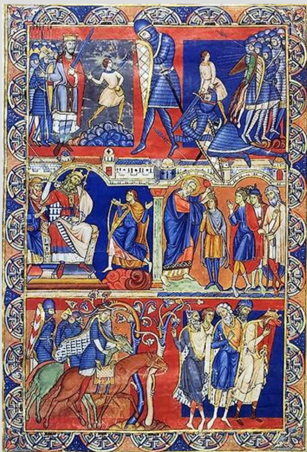
История Давида. Винчестерская Библия. Около 1150-1180 гг.