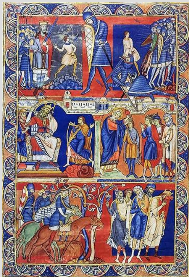
История Давида. Винчестерская Библия. Около 1150-1180 гг.