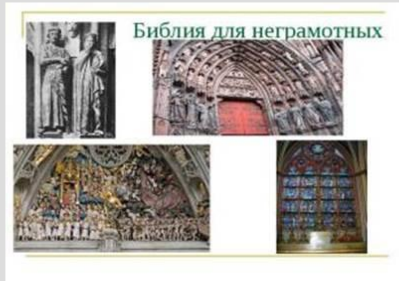
Рис. 2. «Библия для неграмотных»

Историки придумали выражение «Библия для неграмотных» (Рис. 2) – это церковная живопись. Она была понятна практически всем. Церковные росписи, фрески, иконы, мозаики давали образ мира таким, каким его видела церковь.