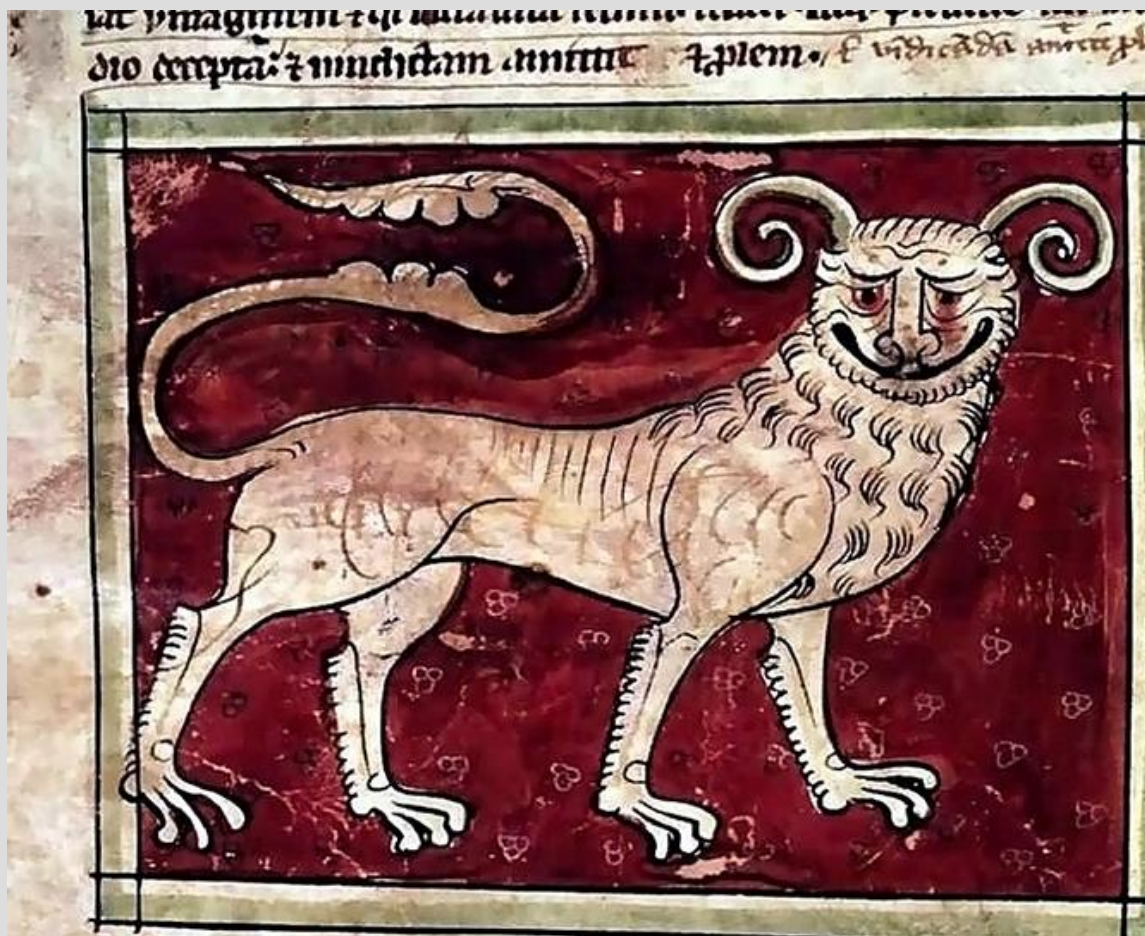
4) Леопард. Бестиарий. XIII век. Северная Франция.