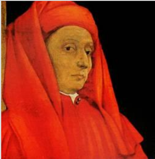
Рис. 10. Живописец Джотто ди Бондоне

Можно назвать такие известные имена средневековых мастеров, как живописец Джотто (Рис. 10), поэт Данте Алигьери , автор знаменитой «Божественной комедии» (Рис. 11).