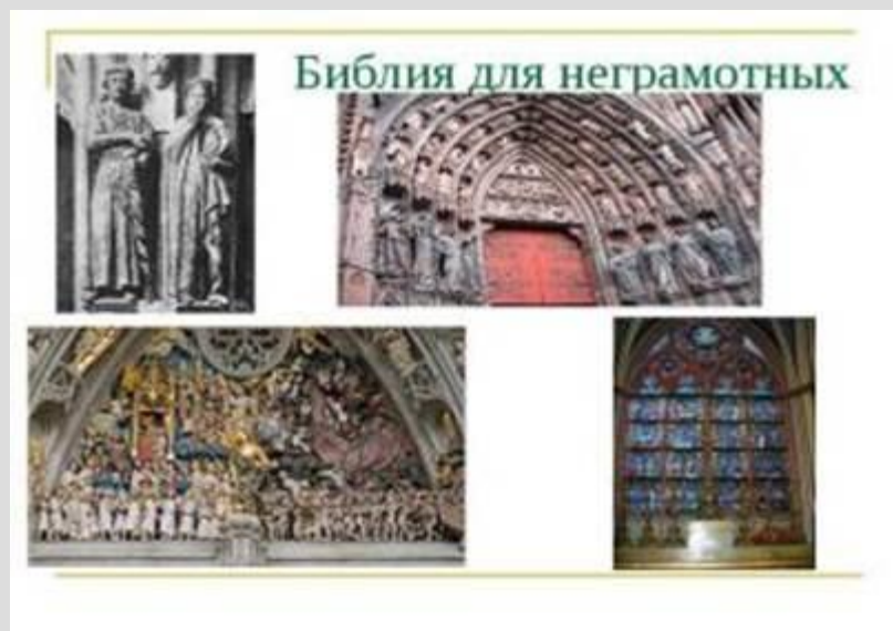
Рис. 2. «Библия для неграмотных»

Историки придумали выражение «Библия для неграмотных» (Рис. 2) – это церковная живопись. Она была понятна практически всем. Церковные росписи, фрески, иконы, мозаики давали образ мира таким, каким его видела церковь.