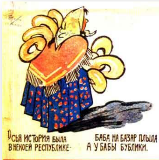
1) СЪЯ ИСТОРИЯ БЫЛА ВНЕЮЕЙ РЕСПУБЛИКЕ- БАБА НА БАЗАР ПЛЫЛА А У БАБЫ БУБЛИКИ.