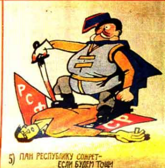
5) ПАН РЕСПУБЛИКУ СОЖРЕТ- ЕСЛИ БУДЕМ ТОЩИ