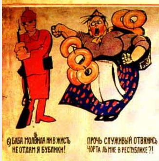
6) БАБА МОЛВИЛА МИ В ЖИСТЬ НЕ ОТАДАМ Я БУБЛИКИ! ПРОЧЬ СЛУЖИВЫЙ ОТВЯЖИСЬ! ЧОРТА ЛЬ МНЕ В РЕСПУБЛИКЕ?!