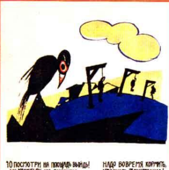
10) ПОСМОТРИ НА ПОХОДЬЕ ВЫИДИ! НИ КРЕСТЬЯН! НИ СИТНИКИ! НАДО ВОВРЕМЯ КОРИТЬ КРАСНОГО ЗАЩИТНИКА!