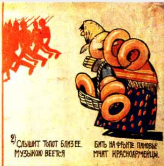
2) СЛЫШИТ ТОПОТ БЛИЗ ЕЕ. МУЗЫКОЮ ВЕЕТСЯ БИТЬ НА ФРОНТЕ ПАНОВЬЕ МЧАТ КРАСНОАРМЕЙЦЫ.

ИСТОРИЯ ПРО БУБЛИКИ И ПРО БАБУ НЕ ПРИЗНАЮЩУЮ РЕСПУБЛИКИ