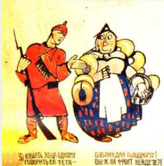
3) КУШАТЬ ХОЦА ОДНОМУ ГОВОРИТЬ ЕЕ-ТЕТЯ- БУБЛИКИ ДАИ ГОЛОДНОМУ! ВЫЖ НА ФРОНТ НЕЙДЕТЕ?!