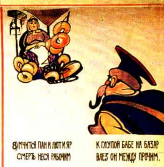
8) ГИЧЕТСЯ ПАН И ЛЮТИ ЯР СМЕРТЬ НЕСЯ РАБОЧИМ К ГЛУПОЙ БАБЕ НА БАЗАР ВЛЕЗ ОН МЕЖДУ ПРОЧИМ.