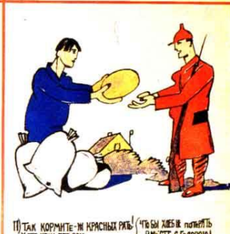
11) ТАК КОРИМТЕ-И КРАСНЫХ РЫБ! ХЛЕБ НЕСИ БЕЗ ВАНО ЧЬ БЫ ХЛЕБ И ПОПЫТЬ ВЫРЕТЕ С ГОЛОВИИ!