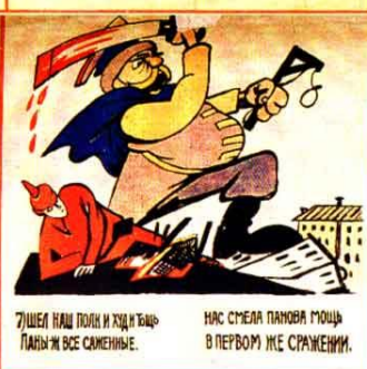
7) УШЕЛ НАШ ПОЛК И ХОДИТЬ ПАНЫЖИ ВСЕ САМЕННЫЕ. НАС СМЕЛА ПАНОВА МОЩЬ В ПЕРВОМ ЖЕ СТРАЖЕНИИ.