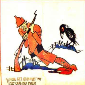
4) КОЛЬ БЕЗ ДЕЛА БУДЕТ РОТ БУДУ СЛАБ КАК МОЩИ