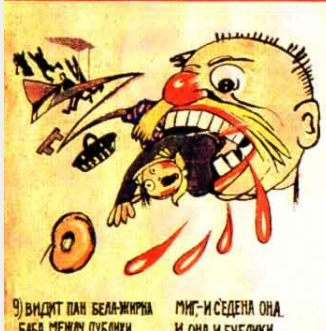
9) ВИДИТ ПАН БЕЛА-ЖИРНА БАБА МЕЖДУ БУБЛИКИ. МИГ-И СЕДЕНА ОНА. И ОНА И БУБЛИКИ.